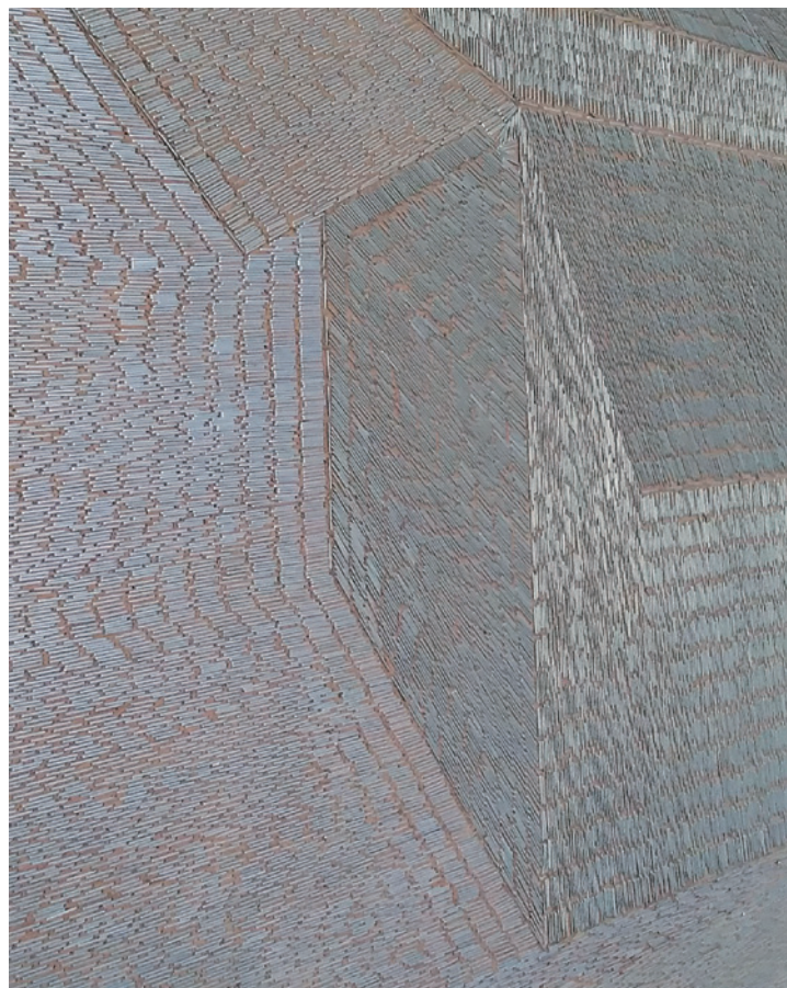
TARR HAJNALKA Nyitott dolgok színeváltozása, 2012, rétegelt lemez, tűzőkapocs, 124×150×20 cm, részlet

Szintén a jelentés keresése a központi eleme BENCZÚR EMESE sörösdobozok nyitófüleinek gyűjtéséből, majd összerendezéséből születő munkájának ( OPEN YOUR MIND , 2016, 70×300 cm). Ahogyan már korábban is megszokhattuk, most is egy szöveg alapú gondolatot kapunk az alkotótól. Benczúr felszólítása a szöveg és a felhasznált anyag kapcsolatának asszociatív rendszerében válik értelmezhetővé, amit az alapelem, jelen esetben a fémdobozok nyitófülének ismétlésével (de még megszámlálható mennyiségben), 5 a gyűjtés időbeliségével tetézi. Ezzel adva súlyt az amúgy elsöre közhelyesnek is tűnő kijelentésnek: OPEN YOUR MIND .