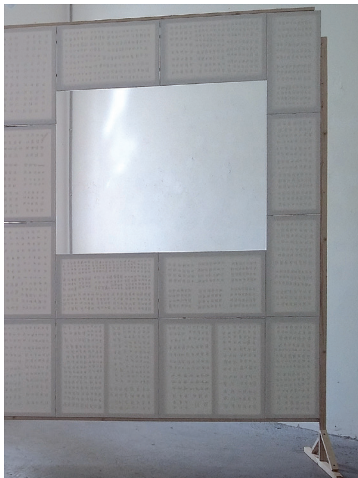
SZIRA HENRIETTA Otthon vagy?, 2015 fényű tülevelek, festővászon, fenyőfa keret, 242×304 cm, részlet