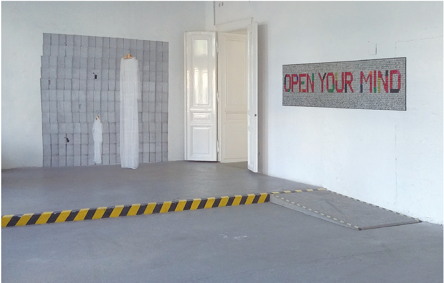
BENCZÚR EMESE OPEN YOUR MIND, 2016

és újra eljátszik bizonyos elképzelt történeteket. Ez az ismétlődés akkor még minden alkalommal újdonságot hoz, azonban már felnőttként megélni ezt a monotonitását nem mindig egyszerű. A bemutatott művek és a mögöttük álló alkotómódszer, a rendszer és az alapelemek ismétlése révén egy olyan lassú idő megtapasztalásának lehetőségét kínálja fel, amely semmi esetre sem azonos a hétköznapi felülről szabályozott időkezelésével. Sokkal inkább kelti fel a hangtalan időtlenség képzetét. Segít kilépni a Henri Lefebvre által karórak idejének titulált, homogén és deszakralizált időmasszából. 7 Az általa „alkalmazott időnek” 8 nevezett intervallum szándékolt előidézésében és megélésében az idő múlása nem, vagy legalábbis másképpen számíthat. Ugyanakkor az idő kérdésén túl a folyamatok fizikai hatása is jelentőssé válik, hacsak a felkészülés, a gyűjtés és a létrehozás fázisait vesszük is. Ez a metódus bizonyos ponton hasonlítható a repetitív zenemű megszólalásának, mind a zenészt mind a befogadót igénybevevő folymat-megéléséhez , vagy a táncban jelentkező mozdulatisméltések szerkezetéhez és dinamikájához.