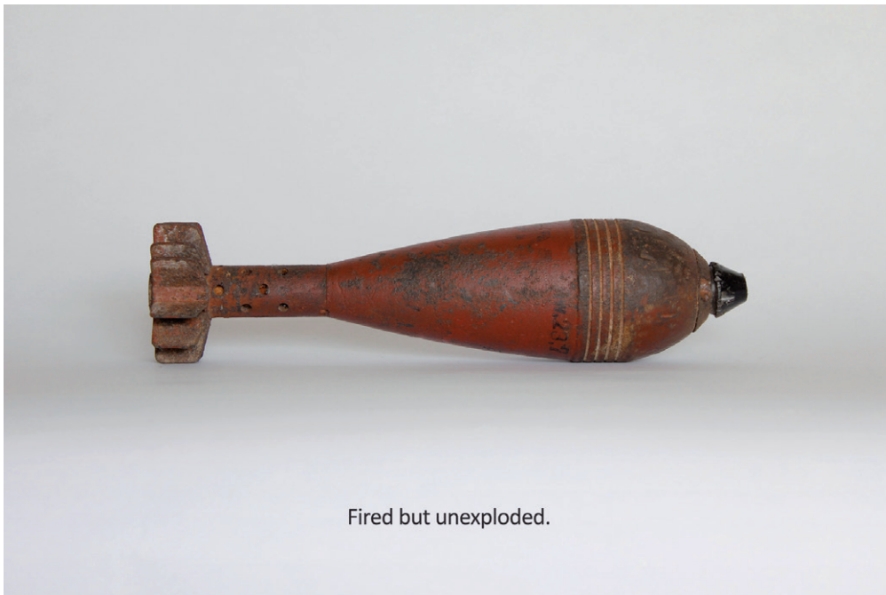
Fired but unexploded.

ASZTALOS ZSOLT Kilőtték, de nem robbant fel. Bomba, 2013