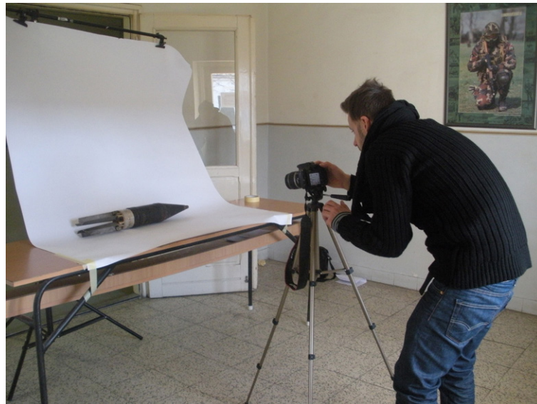
ASZTALOS ZSOLT Kilőtték, de nem robbant fel. Munkafotók, 2013

és a dánoknál a migráció volt a középpontban, 12 a finneké, illetve az északi pavilonban a civilizáció és a természet konfliktusa, 13 az ukránoknál az úttörők és a honvédelmi gyakorlatok jelensége, 14 a libanoniaknál pedig a repülőgép-katasztrófa. 15 A médiumhasználatot tekintve is hasonlóak voltak ezek a munkák a mi kiállításunkhoz.