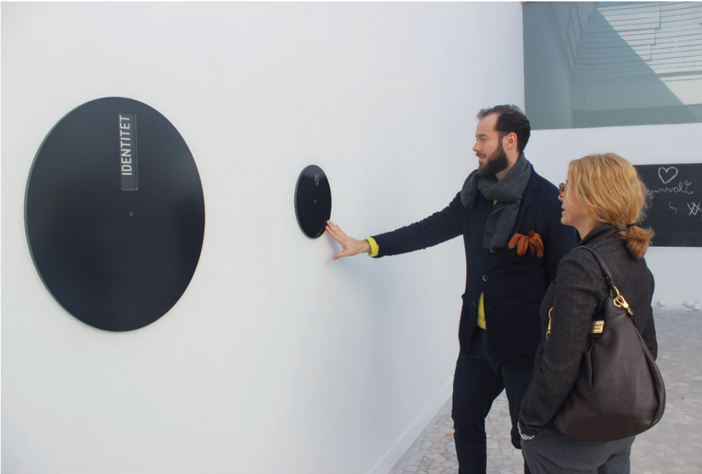
CSEKE SZILÁRD Fenntartható identitások, 56. Esposizione Internazionale d'Arte. La Biennale di Venezia. Magyar Pavilon, Velence, 2015 | participáció