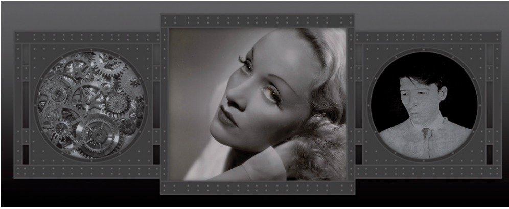
108 Illusztráció a SPIONS Just a Machine (Marlene Dietrich) című számához, 2016 digitális kollázs, a SPIONS archívumból

aktus elején mind a ketten nevetőgörcsöt kaptak, úgyhogy házastársi kapcsolatuk a továbbiakban közös balhékból és gyakori verekedésekből állt. „Én voltam az erősebb. Egyszer akkorát behúztam neki, hogy átesett a kanapén és a fejével összetörte az üvegasztalt. Többé nem használta a rúzsomat”, mondta Edwige. Irított a politikától, amely így vagy úgy az angol punk mozgalom fókuszában állt. Őt, igazi francia nőhöz illően, a divat vonzotta. Ő volt az első celebek egyike, aki keverte a drága ruhákat a rongyokkal. „A Mathématiques Modernes egyik koncertjén cafatokra szakadt farmernadrágot viseltem vadonatúj Chanel zakóval és push-up melltartóval. 44 ”, mesélte, amikor sok év után New Yorkban futottunk újra össze. „Philippe Guibourge, a Chanel akkori tervezője megszerzte nekem az összes Chanel terméket, amit csak akartam. Számomra a Chanel az 1950-es éveket idézte, azt a hangulatot akartam visszahozni. Nem akartam olyan lenni, mint az összes punk Párizsban, akik teljesen egyformán öltözködtek. Sikkesebb akartam lenni náluk.”