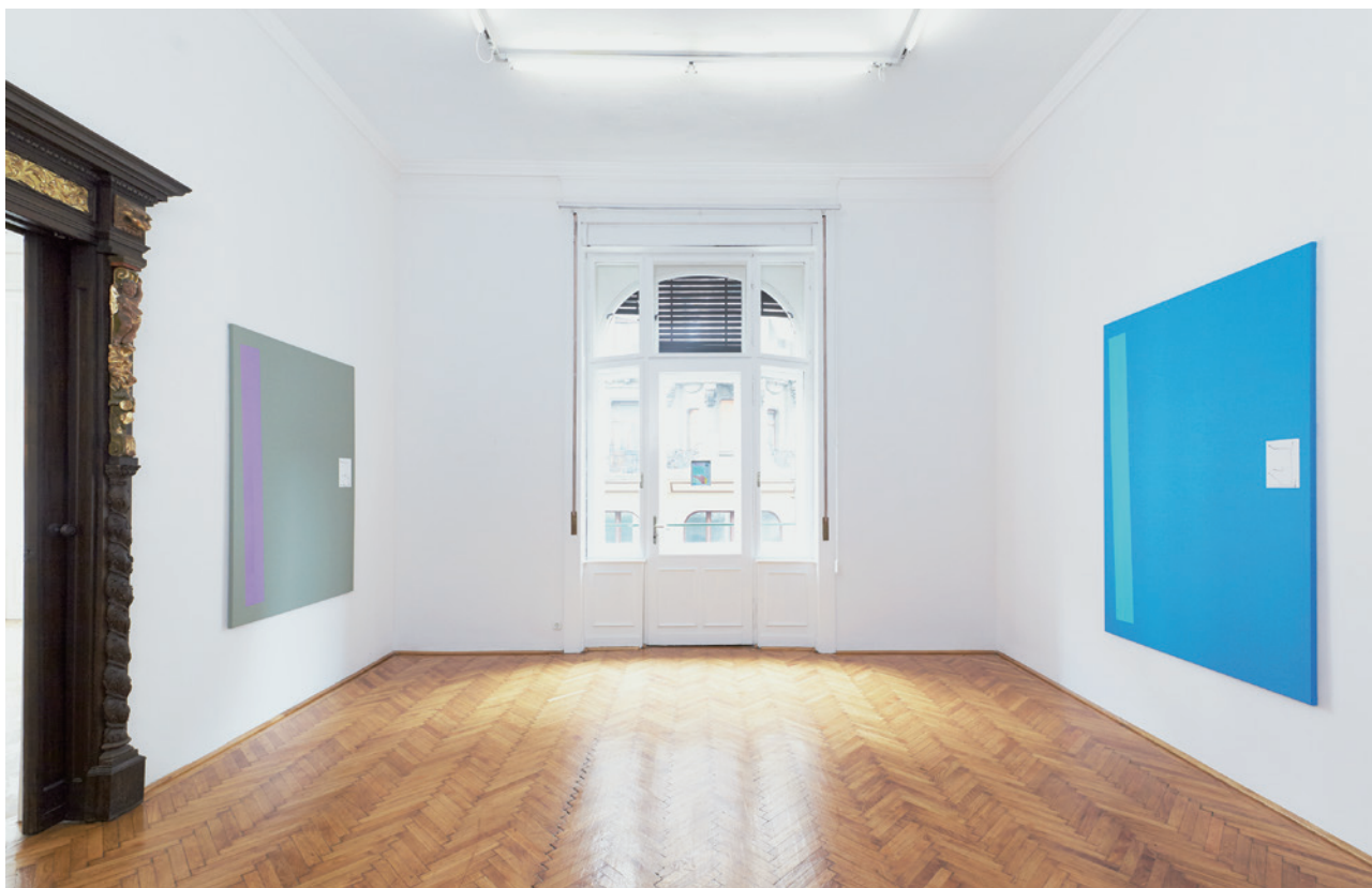
SZINYOVA GERGŐ Imaginary Viaduct Art+Text Budapest 2016 október 5 – október 30.