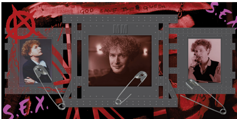
NAJMÁNYI LÁSZLÓ Timeship ORGON: Malcolm McLaren Shrine, 2016 digitális kollázs, SPIONS archívum

Artø) a pop song 8 – készítettem az alkalomra, amelyek a dokumentumgyűjteménnyel együtt az előadások során és a punktörténeti kiállítás nyitvatartása alatt terjesztett VideoBook 108-ba kerültek, kiegészítve az elmúlt évtizedek során megszületett SPIONS-videók közül válogatott másik 12-t. Elérhetővé tettem az 1989–90-ben, Észak-Amerikában íródott THE COSMIC BARGAIN rock-operettünket bemutató, 2011-ben összeállított SPIONS REVIVAL Volume I videóköny megmaradt néhány példányát is.