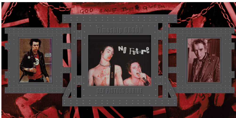
NAJMÁNYI LÁSZLÓ Timeship ORGON: Sex Pistols Shrine, 2016 digitális kollázs, SPIONS archívum

Sajnos a videó-műveket a lakók berzenkedése miatt csak nagyon halkán lehetett bejátszani. A hangerő hiánya – hangosságot igénylő punk és afterpunk zeneművekhez készültek a videók – kasztrálta, hatástalanította a vetítéseket. Az előadás végén a nemzeti érzelmű rock-újságíróval beszélgetve ráébredtem, hogy a három magyarországi SPIONS-show közül csak