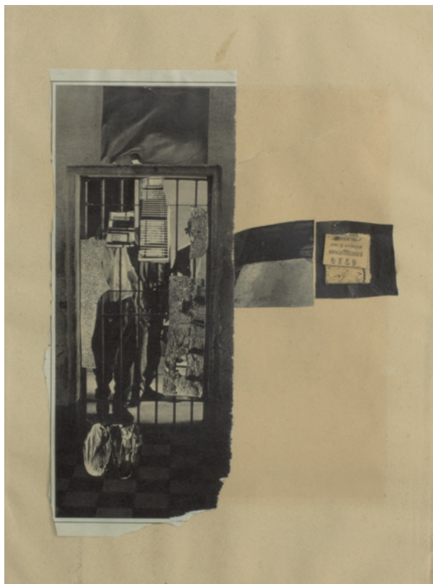
RÁKÓCZY GIZELLA Váltás, 1973, papírkollázs, 29 x 23 cm