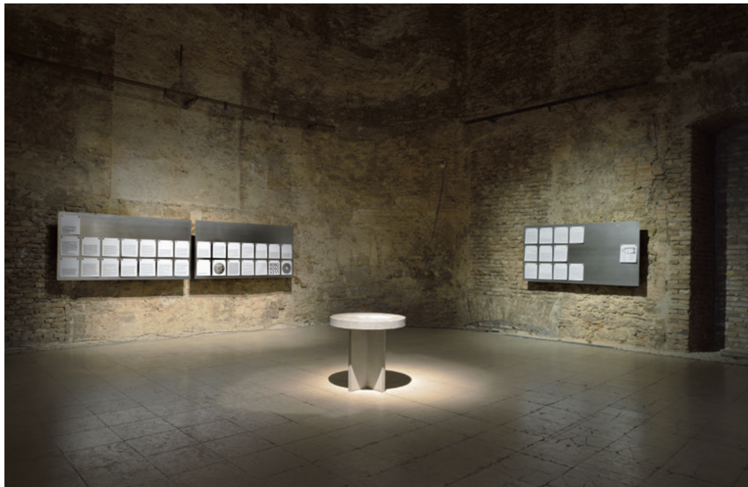
Gróf Ferenc Mutató nélkül – B.A. úr X-ben