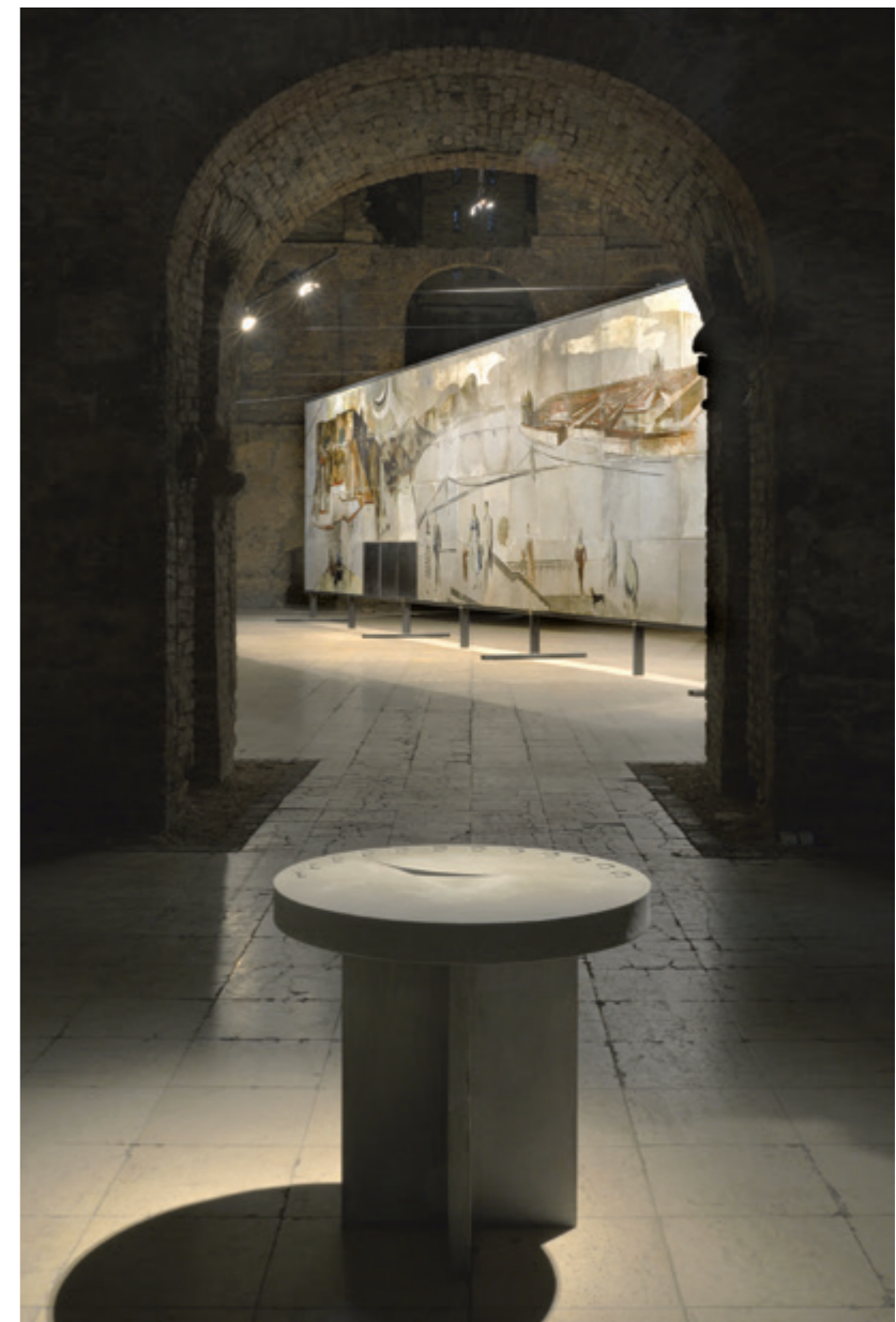
Gróf Ferenc Mutató nélkül – B.A. úr X-ben

elemi érdeke volt, hogy saját, új helyzetét biztosítsa a sztálinista politika bukása után. A pavilon és a kiállított munkák modernista hangvétele nem minden esetben találkozott a hivatalos kultúrpolitika feltétlen támogatásával, de a néhány évvel korábbi, szocialista realista irányhoz képest mégis szinte forradalminak számított.