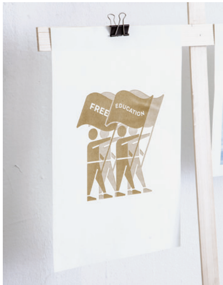
Máté Dániel Felsőoktatás szabadsága, 2017, rizográf print | Magánideológiák , Az MKE Művészeti és Művészetelméleti Szakkollégium Kötöde munkacsoportjának kiállítása