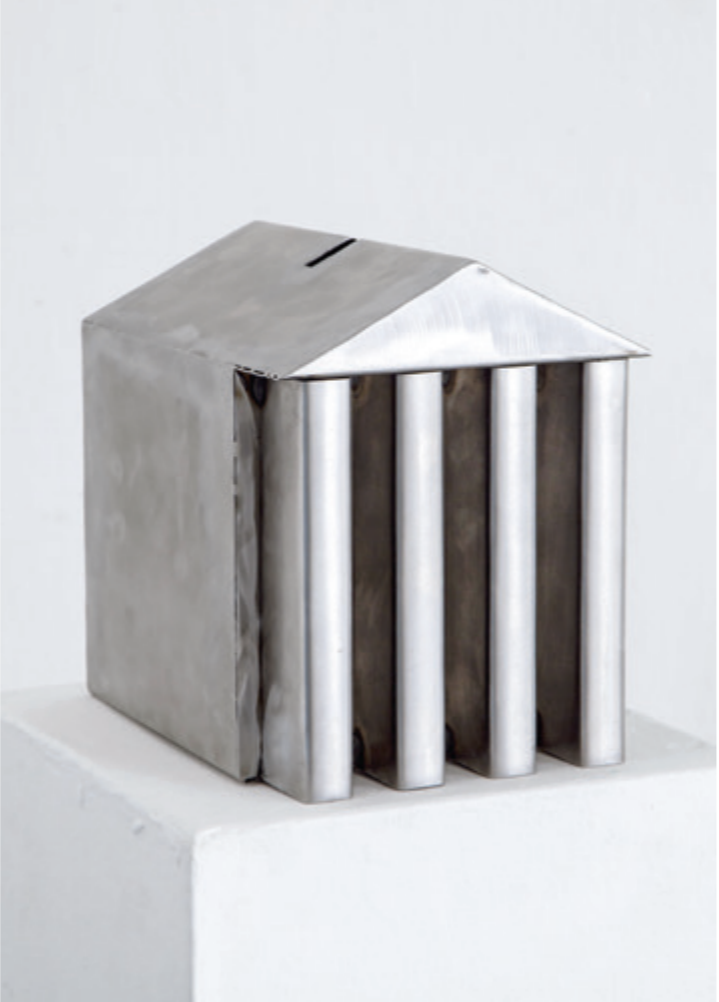
Maté Dániel Akadémia persely, 2017, hajlított, hegesztett nyersacél lemez, 250 x 200 x 250 mm | Magánideológiák, Az MKE Művészeti és Művészetelméleti Szakkollégium Kötöde munkacsoportjának kiállítása

ismétlődve feltűnnek a politikai ideológiák szolgálatába állított tartalmak kapcsán.