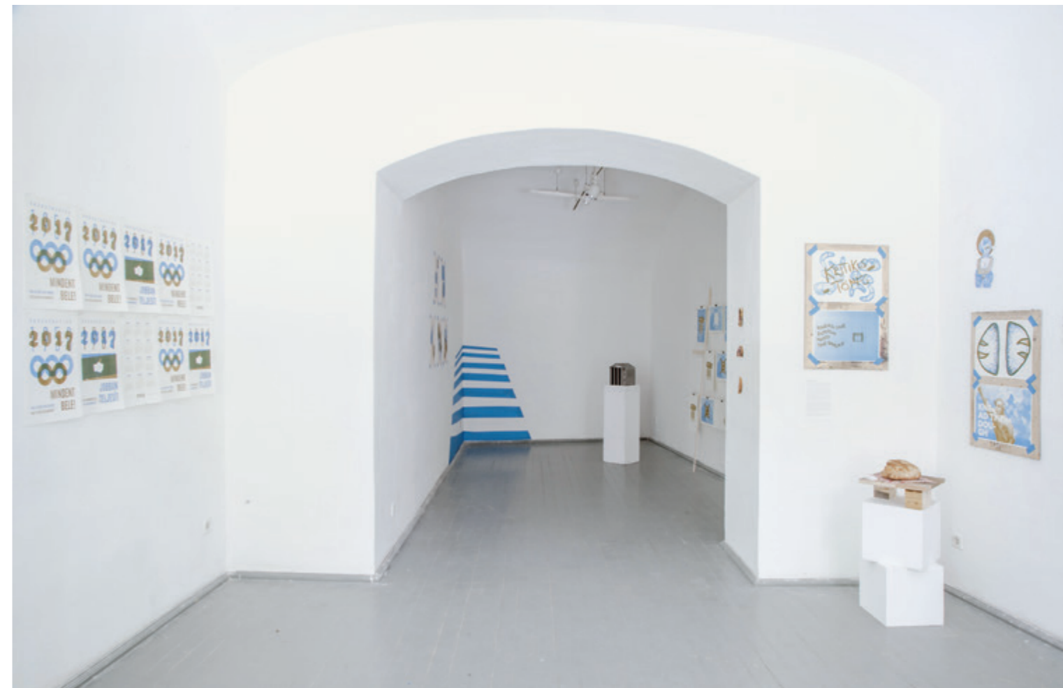
Magánideológiák , Az MKE Művészeti és Művészetelméleti Szakkollégium Kötöde munkacsoportjának kiállítása (részlet)

– változásnak, de a kifejezés nyelvének differenciálódásában mindenképpen nyomon követhető állapotnak az okai, eredője? Részle lehet-e ebben – bármilyen szinten is – a köz- és a felsőoktatásnak? S ha igen, melyik oktatási forma jelent valódi megoldást, de legalábbis menekül utat a hazai, egyre inkább központosított szabályozásra épülő, autonómiájában korlátozott szűkített rendszeren belül? Innen nézve válik kitüntetett pontjává a helyzetképeknek az Magyar Képzőművészeti Egyetem (MKE) Művészeti és Művészetelméleti Szakkollégiumában tevékeny (MMSZK), KÖTÖDE+ munkacsoport kiállítása: a Magánideológiák magától értetődő módon illeszkedik