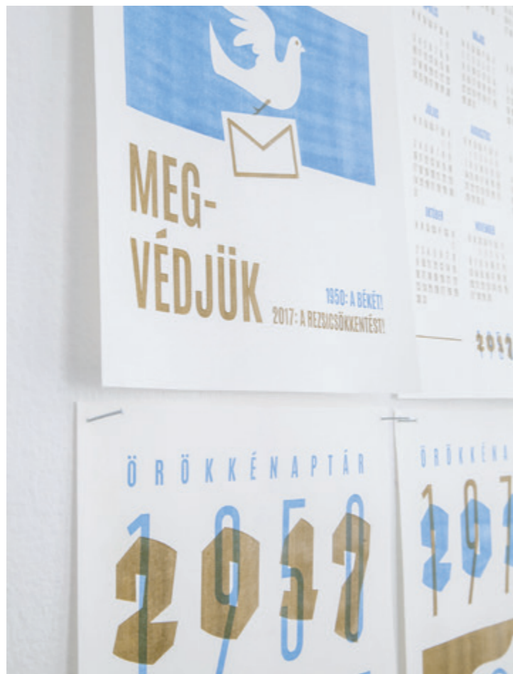
Imre Réka Öröknaptár, 2017, rizográf print | Magánideológiák , Az MKE Művészeti és Művészetelméleti Szakkollégium Kötöde munkacsoportjának kiállítása