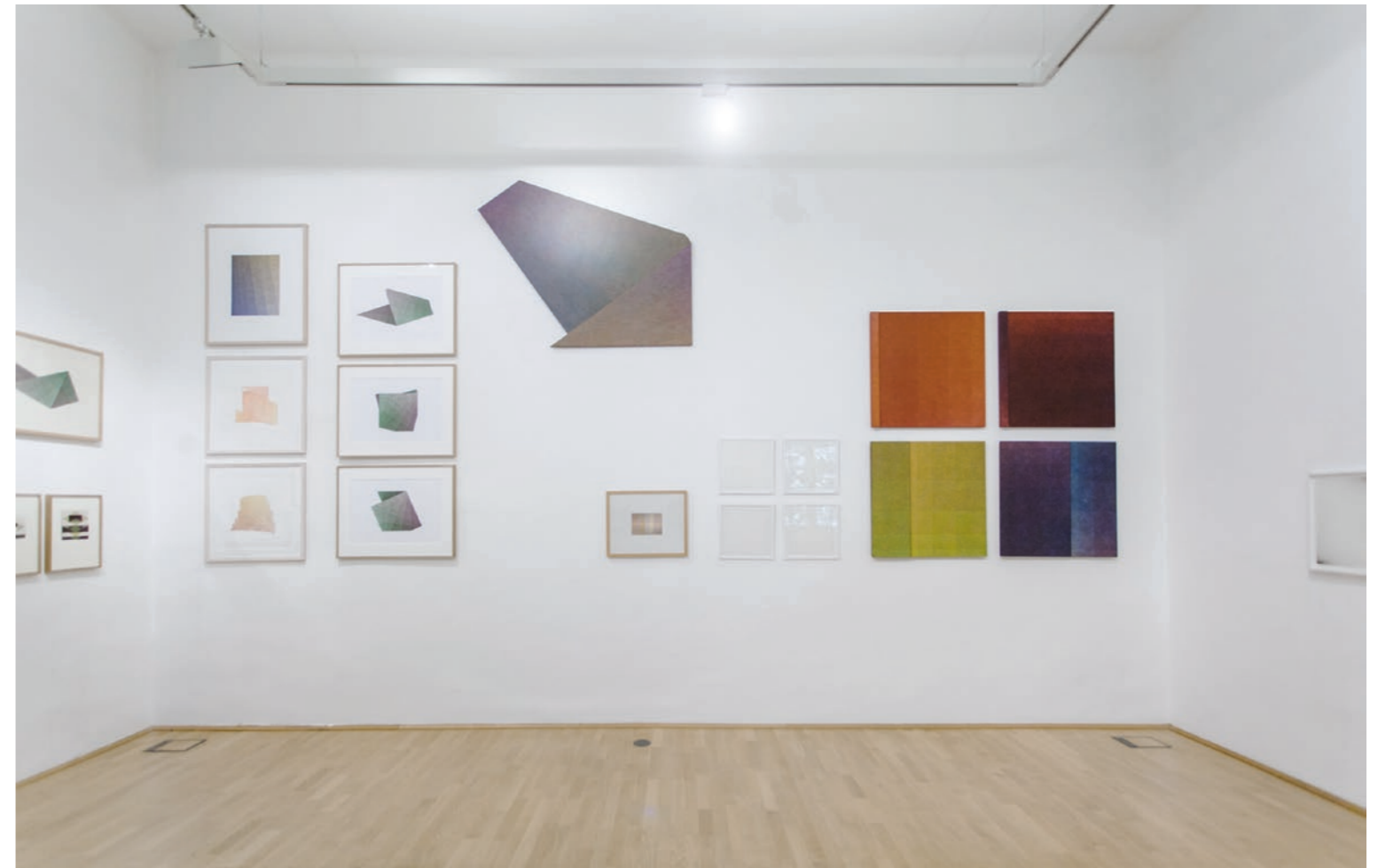
Különutak. Karl-Heinz Adler és a magyar absztrakció Kassák Múzeum, 2017. június 1 – szeptember 17.