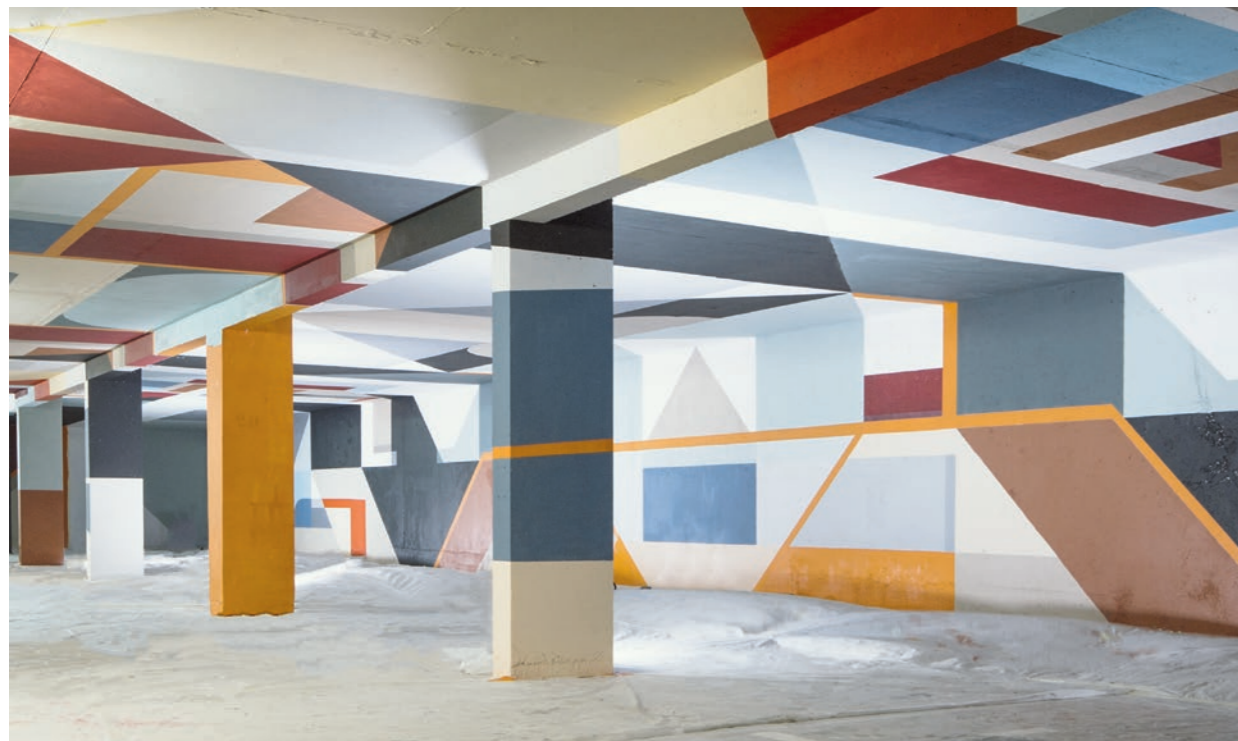
Swiz © Fotó: Jean-Yves Raffort | Commune de Saint-Gervais