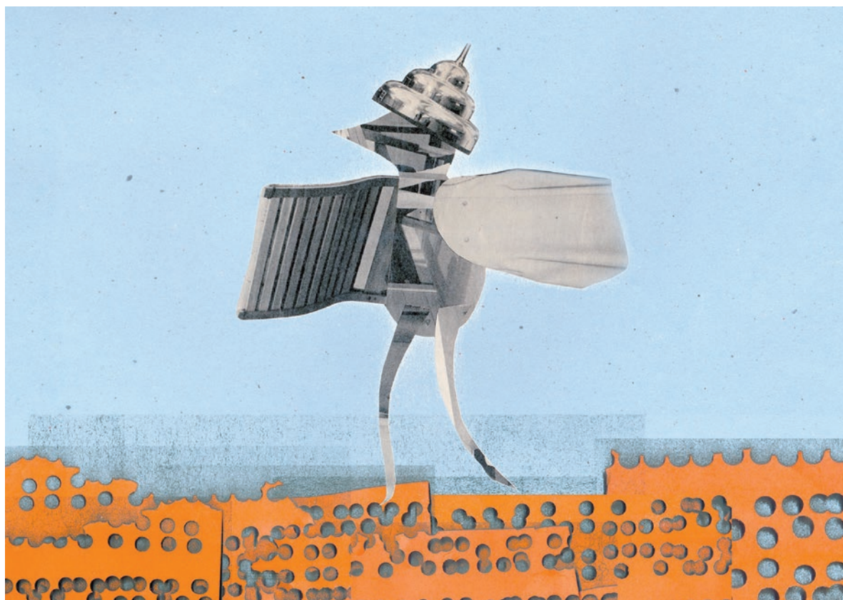
TILLMANN HANNA: Énekesmadár, 2017, kollázs