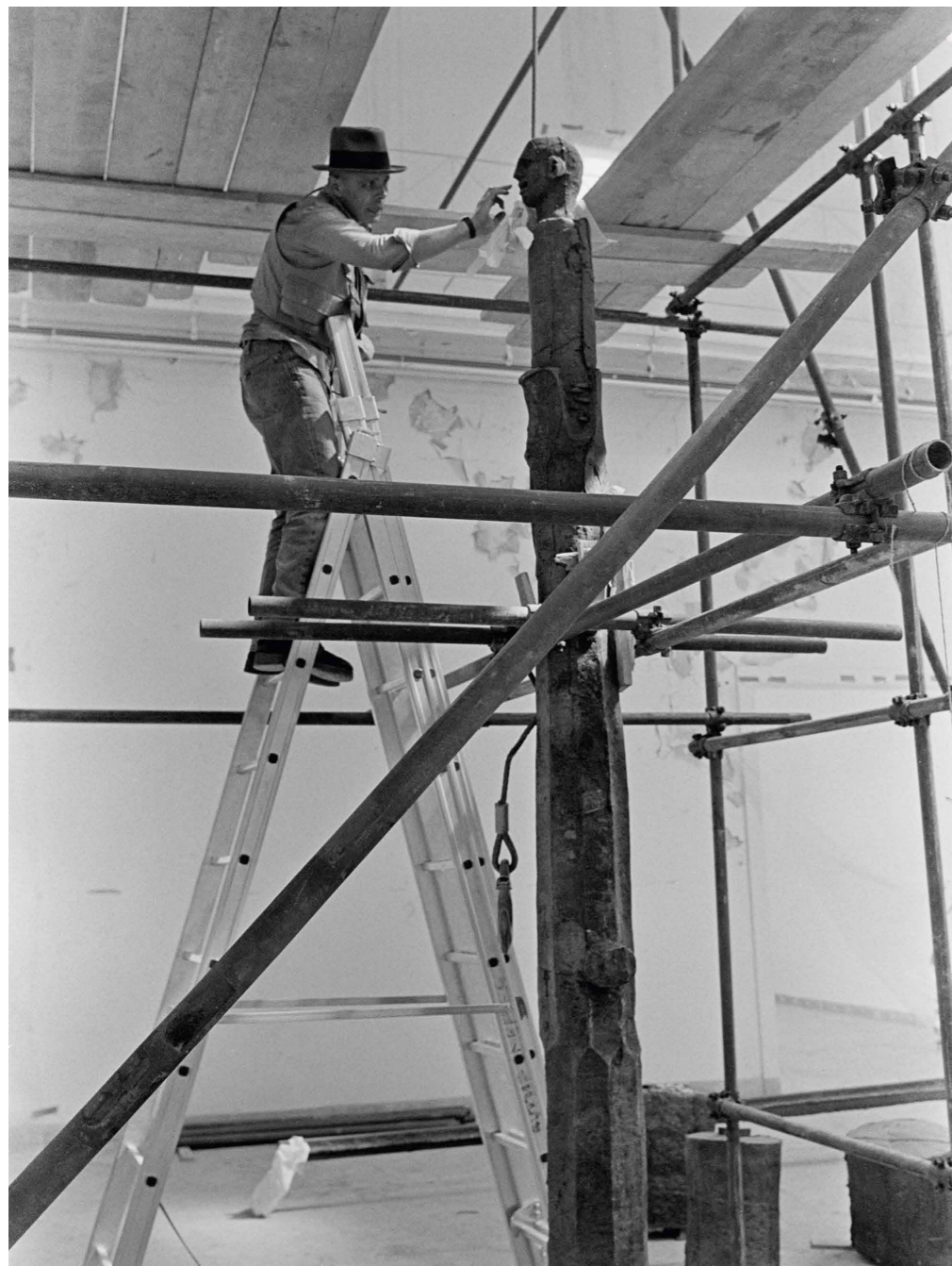
Joseph Beuys Villamosmegálló, 1961-1976, a jövő emlékműve, Velencei Biennále 1976