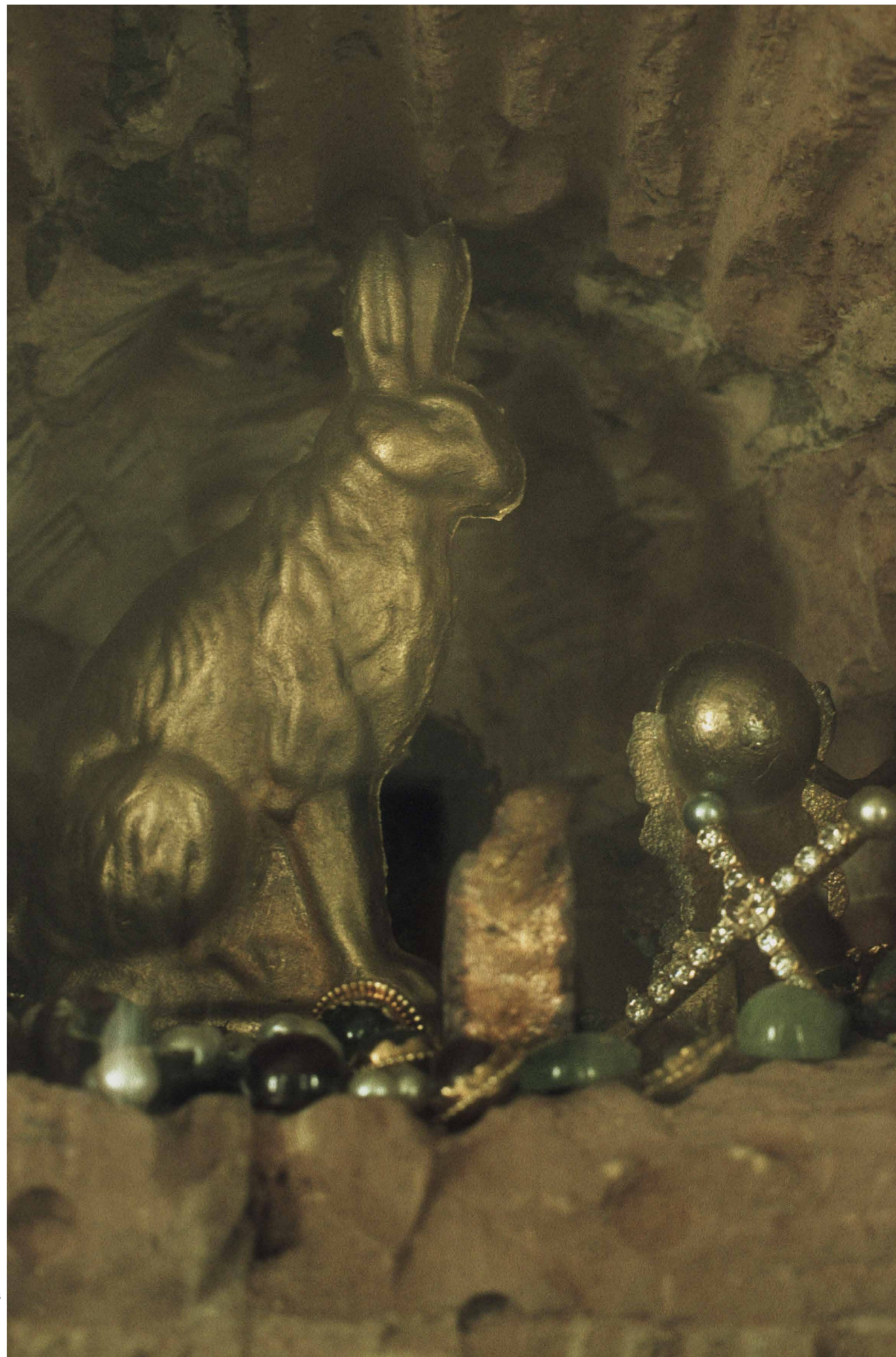
Joseph Beuys Béke-nyúl tartozékokkal, documenta 7, Kassel, 1982 © Joseph Beuys | VG Bild-Kunst