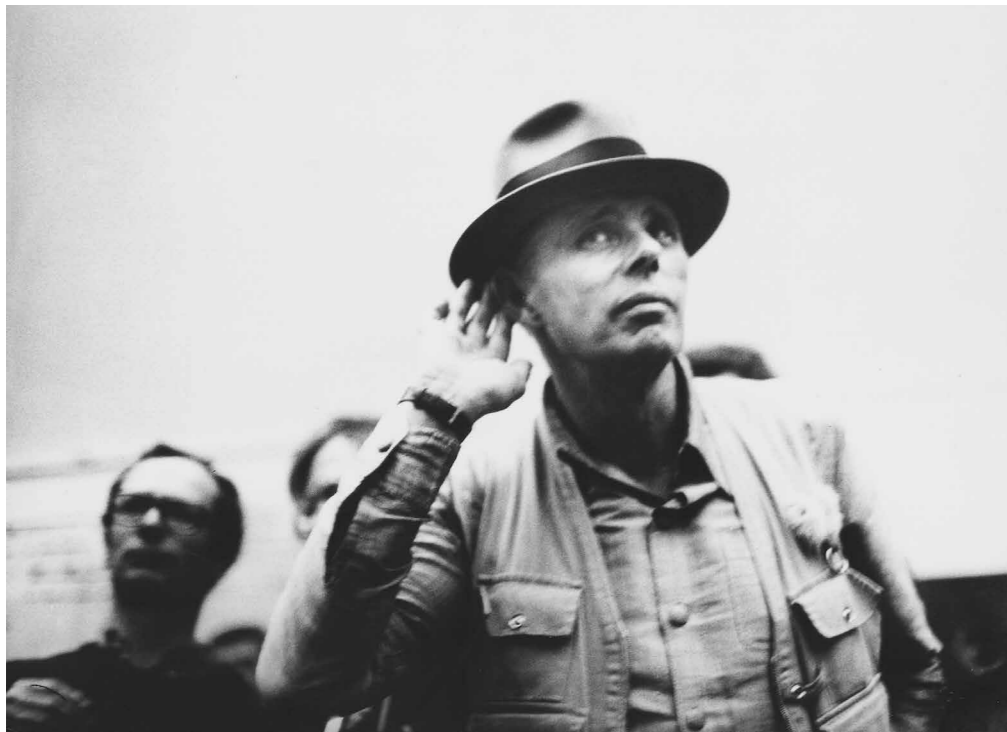
Hallgasd csak! jelenet Andres Veiel Beuys című dokumentumfilmjéből

Beuys azonban komolyan gondolta, úgyhogy mehettem a városi önkormányzathoz meg a képviselőtestület elé, elmagyarázni, hogy mit tervez a következő documentára . Ők meg bámultak rám, mintha elment volna az eszem. Azt mondták, tudja maga mit jelent az, hogy 7000 fát közterületen elültetni? Mivel jár az aszfaltot felmarni, meg a többi, ami még ezen kívül kell, és hogy mi pénz az, de én csak erősködtem. Hatvan, egy szállal sem több, mondták, én meg azt válaszoltam, hogy ha Beuys ezt mondta, akkor meg is fogja csinálni. Egy héttel később megérkezett Beuys is, előadta a tervét, ők pedig rábólintottak.