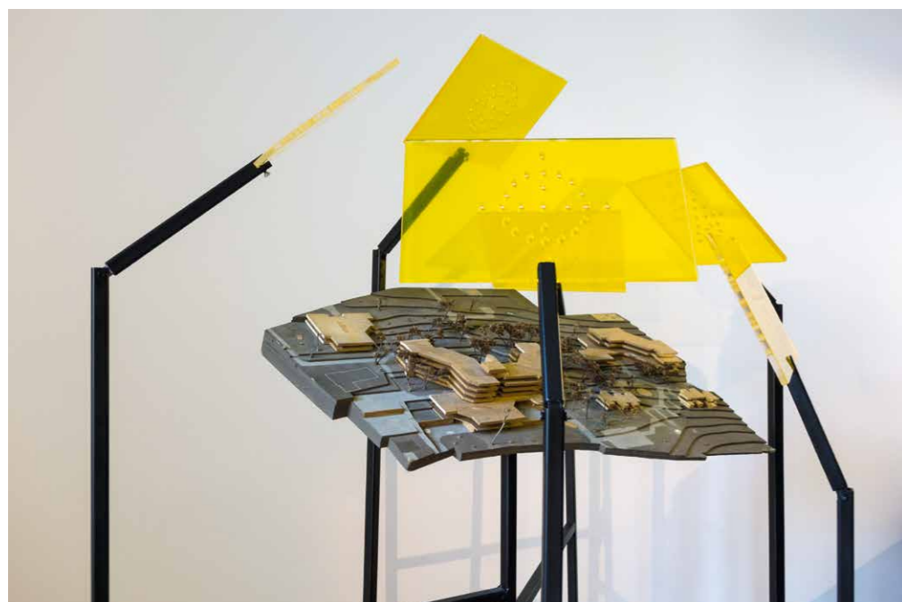
Szörényi Beatrix Egy makett a múltból, 2015, plexi, fém, fólia, fa

származó hagyaték is megtalálható, ami még azonban nincs katalogizálva. Ádám kezdettől fogva szemezett ezzel, és egy vitrines megoldásban gondolkodott. Végül az ólomüvegeit ezzel összhangban, a Paksi Képtárban is bemutatott betonöntési technikával installálta.