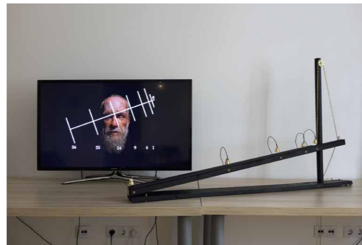
Cséfalvay András Ki tért vissza a kísérletből, és mi maradt hátra, 2017, kísérlet replika, videó- és hanginstalláció szöveges kommentárral