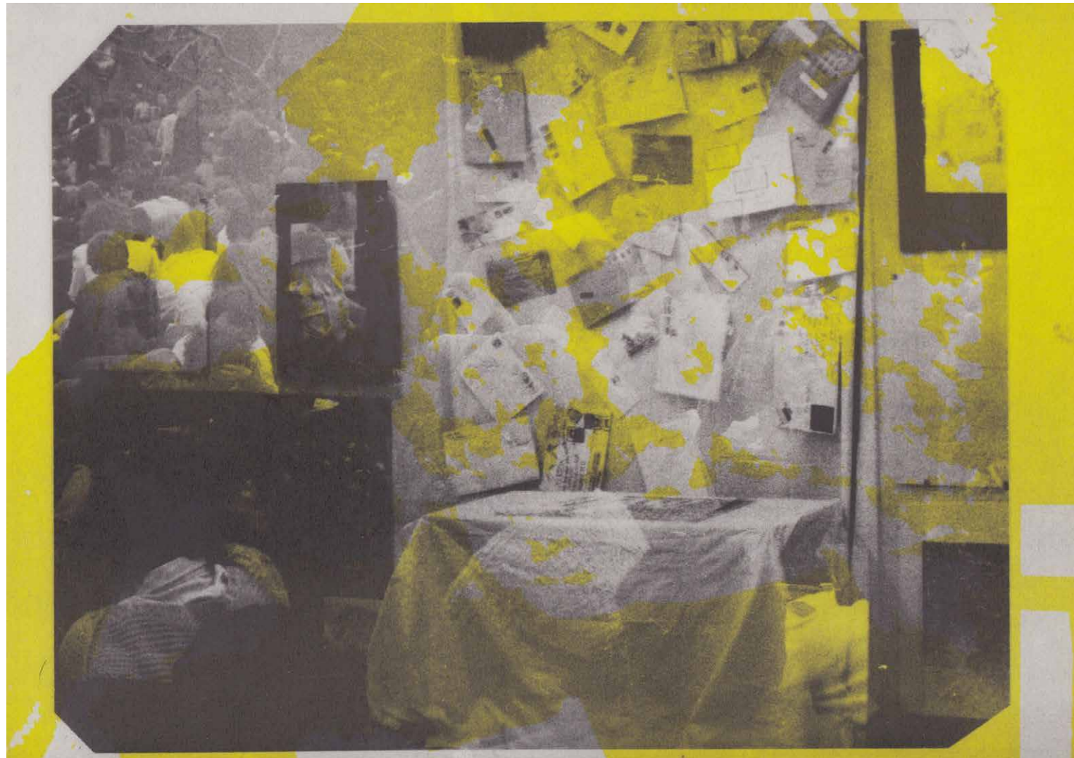
Xertox Emberkísérletek (Mail-Art kiállítás) Budapest, Bercsényi 28-30. Xertox 3. Dolgos Meditáció , 1982.10.12.

szöges ellentéte. A folyamat eredményét, a felsejülő szabadságfokot, új ismeretet nem laboratóriumi körülmények között próbálta reprodukálni, majd a tapasztaltak alapján újra előidézni, hanem sokkal inkább egy adott helyzetre reflektáló spontán, előre el nem tervezett folyamat végrehajtásával.