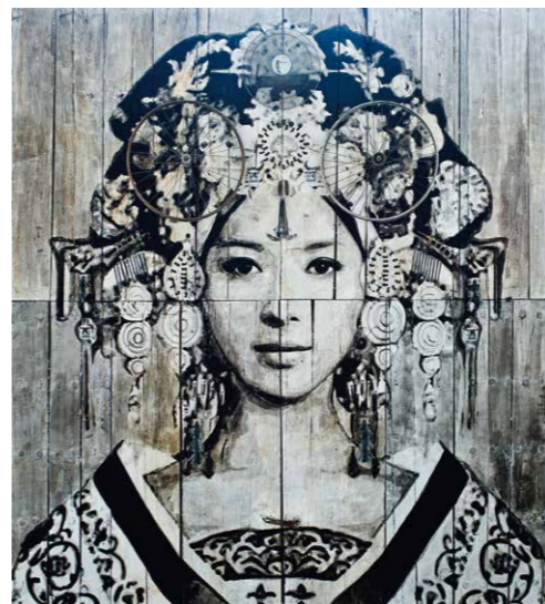
YZ Wu császárné, 2015, festmény antik ajtókon | Art of the Streets , ArtScience Múzeum, 2017

katonai bázisán is szabadítottak fel helyet. A trópusi növényekben dús parkban található fehérre festett házak, amelyekben 2012 óta nemcsak délkelet-ázsiai, hanem nemzetközi galériák is működnek, már egyáltalán nem emlékeztetnek katonai objektumra. A galériák mellett egy Kortárs Művészeti Kutató Központ, 10 valamint egy, művészeti szervezetek és gyermekek számára fenntartott kreatív stúdió 11 is működik itt. A tizenkét galéria nincs egyszerre nyitva, viszont működésük úgy van összehangolva, hogy mindig találunk megnézhető, illetve bezáró vagy éppen nyitás előtt álló, készülő kiállításokat. Élő, folyamatosan látogatott hely, ahol péntek esténként az ún. „After Dark” program eseményei, szombatonként pedig további délutáni művészeti rendezvények, vezetések, rezidens és pop-up kiállítások is zajlanak. A február végén, március elején látható kiállítások közül a ShanghART Galériában MELATI SURYODARMO Timoribus című fotósorozatokon, videofilmeken alapuló, önreprezentációs- és önnarratív kiállítása 12 volt nagyobb volumenű, és egy másik művésznő, YEO KAA irónikusabbra hangolt, festményekből és hatalmas (teremnyi) méretű kislányalak-bábuból álló, szintén genderalapú önanalizáló kiállítása a Yavuz