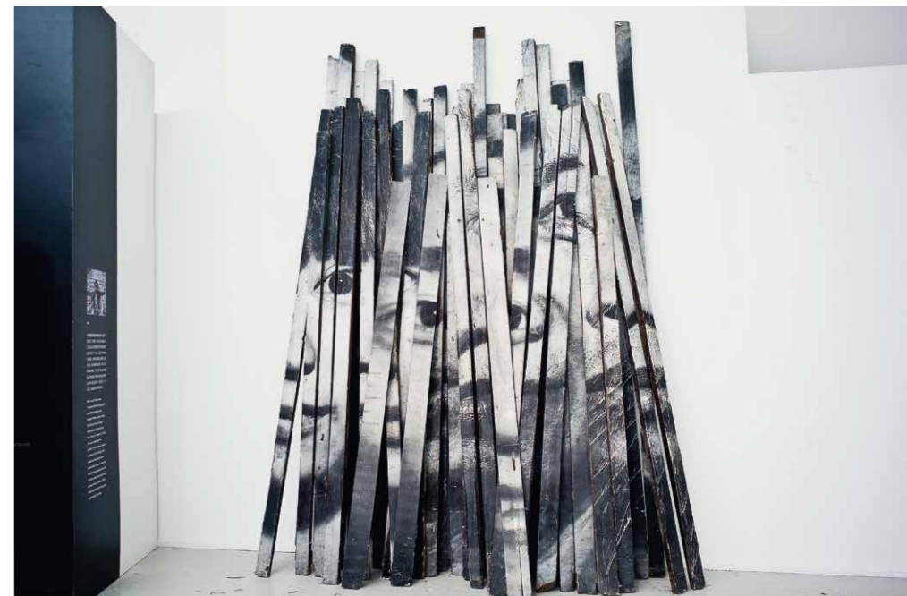
JR Cím nélkül, 2016, fotók, fa | Art of the Streets , ArtScience Múzeum, 2017