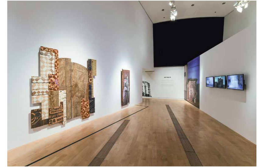
Getting Up Gallery, interiőr

eseményeiről, helyeiről (művészeti vásárok, galérialáncolatok) ismert stílusjegyek, témák, eszközök és anyagok alkalmazása köszön vissza. A kortárs művészet „hivatalos helyszíne” a Singapore Art Museum (SAM), amely két, historikus stílusban emelt épületben működik. 2018. február–márciusban a nagyobb főépület felújítás alatt állt, a kisebbben pedig, amely korábban iskola volt, CINERAMA címmel tíz délkelet-ázsiai művész alkotásait bemutató video-kiállítás futott, amely az emlékezés és identitás témáit állítja középpontba. 5 Animációkat, kisfilmeket, filmes installációkat