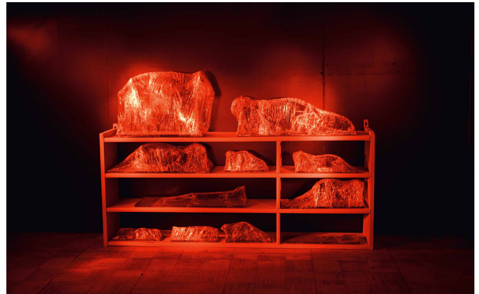
Mark Dion A Tour of The Dark Museum, 2018 (részlet), helyspecifikus installáció, vegyes technika, zseblámpa, változó méret | Az első Riga Biennálé felkérésére. A művész és a brüsszeli Waldburger Wouters jóvoltából. © Fotó: Andrejs Strokins

A fent említett hosszútávú célkitűzés leegyszerűsítve a balti régió sajátosságainak megismertetése a nagyvilággal, valamint bekapcsolása a nemzetközi kulturális vérkeringésbe. Az első RIBOCA 104 kiállítójának egyharmada éppen ezért a három balti államból származik, 70%-a pedig a tágabb értelemben vett régióból, azaz Lengyelországból, Svédországból, Dániából, Finnországból, vagy Németországból érkezett. Emellett a többi kiállító művész nagy részének is van valamilyen régiós kötődése. Szintén a hosszútávú misszió megvalósítását célozza, hogy a biennálé helyszíneken megtekinthető 114 kiállított mű fele kifejezetten a RIBOCA felkérésére készült, így abszolút helyspecifikusnak tekinthető. A szervezők a régió kívüli művészeket is arra ösztönözték, hogy próbáljanak a lokális adottságokra is reflektálni.