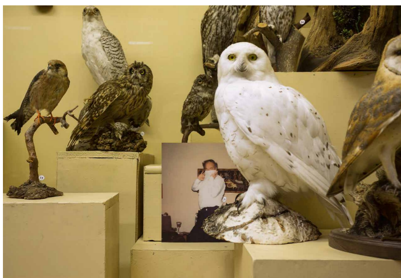
Erik Kessels The Human Zoo, 2018 (részlet), helyspecifikus fotó-intervenció | Az első Riga Biennálé felkérésére. A művész jövöltábol. © Fotó: Vladimír Svetlov

parkban, mesébe illő csatorna partján áll, teljesen elhagyatva és pusztulásnak indulva. A leírásokból sajnos nem derül ki, hogy az épület kihasználtságának mi az oka, belépve a terekbe pedig azzal a megdöbbentő tapasztalattal szembesülünk, hogy sok helyiségben és laboratóriumban az eredeti berendezések is megmaradtak. Mintha egyik napról a másikra kellett volna az oktatóknak és hallgatóknak elhagyni az épületet. A kurátorok és művészek szerencsére úgy döntöttek, hogy a terek kiürítése és neutrális white cube-bá formálása helyett, inkább felhasználják az eredeti funkcióra emlékeztető környezetet. Ezen a helyszínen valósult meg például MARK DION Túra a sötét múzeumban (2018) című helyspecifikus munkája, amely a helyszínen maradt zoológiai gyűjteményből kölcsönöz csontvázakat és preparátumokat. A három egymásba nyíló teremben teljes sötétség uralkodik, amelyet egy halvány piros fényvel világító elem lámpa segítségével deríthetünk fel, mígnem a teremsor végén megérkezünk egy fluoreszkáló csontváz-installációhoz. Már ha elég bátrak vagyunk a kissé hátborzongató élményhez.