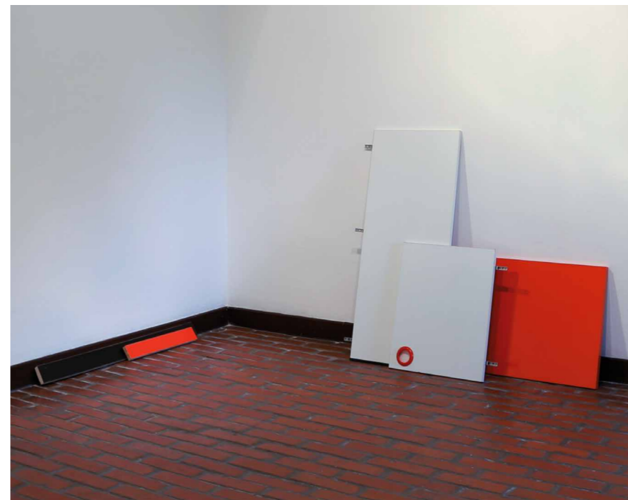
Szentesi Csaba Cím nélkül (disszociatív formaterv), 2014 (részlet)

SZENTESI CSABA: egyelőre sokat gondolkodik, idézget, a modernitás fogalmával operálgat. „Mai rend-fogalmunk a modernitás terméke. A jövőbe mutató, a tökéletesedést ígérő fejlődés eszméje összefonódik a szabályosság, a rendezettség, az észszerűség gondolatával. A fejlődés mint emberi vágy, mint elrendelt terv, program és világmagyarázati elv az Ész mindenhatóságába vetett hitből nyeri értelmét.” – halljuk a háttérben Vágási Feri gondolatait a Szomszédokból . A laminált forgácslapokból jó ebédhez szól a nóta. Hogyan építsünk sörösvüvegéből röntgensövet. Maxicsalád mini ötletei. Utána pacalvacscora és ultiparti. Zárójel: vizsgált időszakban a kiállítás még nem készült el, a mű lapraszerelt állapotban a falhoz támasztva állt – zárójel bezárva.