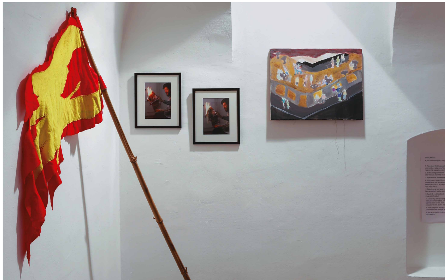
Kótun Viktor Vázlatok egy posztneoavangárd arcképcsarnokhoz No. 1, 2014 (részlet)

vallási önérzetet sért. Az ide szánt „Kezdeti vázlatok egy neoavantgard arcképcsarnokhoz 1” című műegyüttes azonban minden szempontból közveszélyes. A falhoz támasztott kazár-lobogó felesleges indulatfokozás. Szappanbuborék-faktor maximum, gyönyörködtetés-index zérus. Kapitalista. Egyszer Horváth Tiborral is látták. Személye további operatív megfigyelést igényel. Égő dossziéjának nyilvános felolvasását kérem.