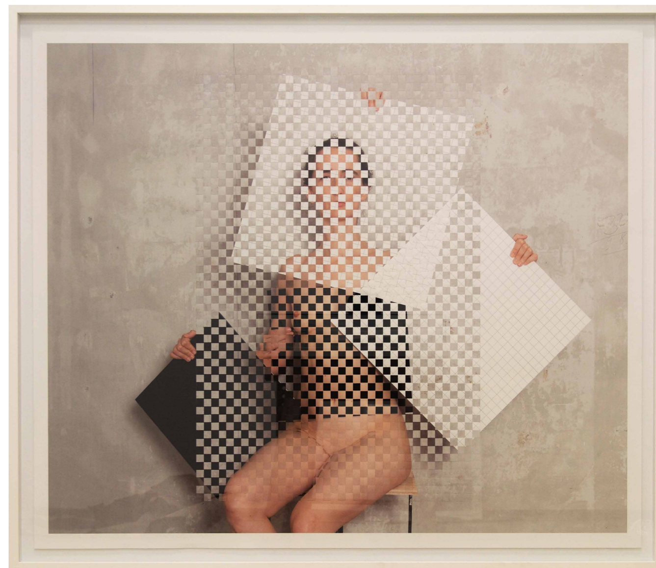
Tarr Hajnalka A nagy síktartó, 2018, giclée print, szövés, 103×120 cm

Számomra mindig is fej-fej mellett haladt a valóság vegytiszta formában való látásának éltető vágya és a valóságtól való ösztönös félelem/inkompetencia