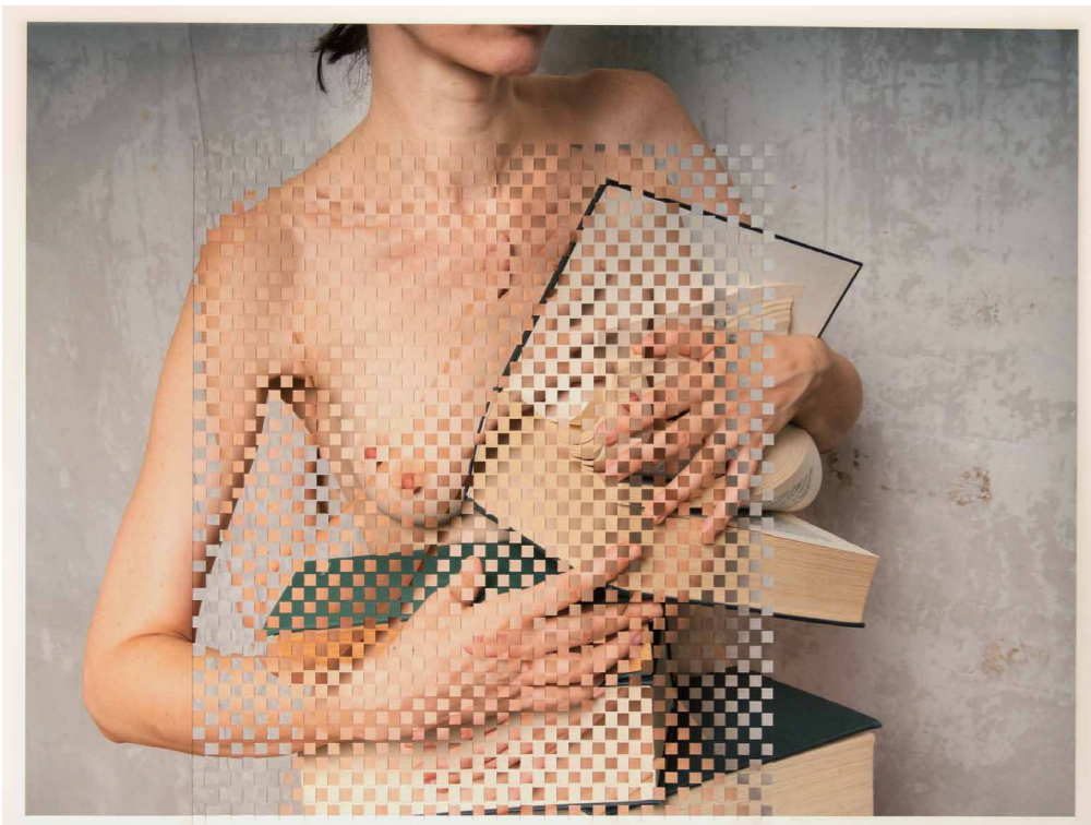
Tarr Hajnalka Tárgykapcsolat 64, 2018, giclée print, szövés, 56×73 cm