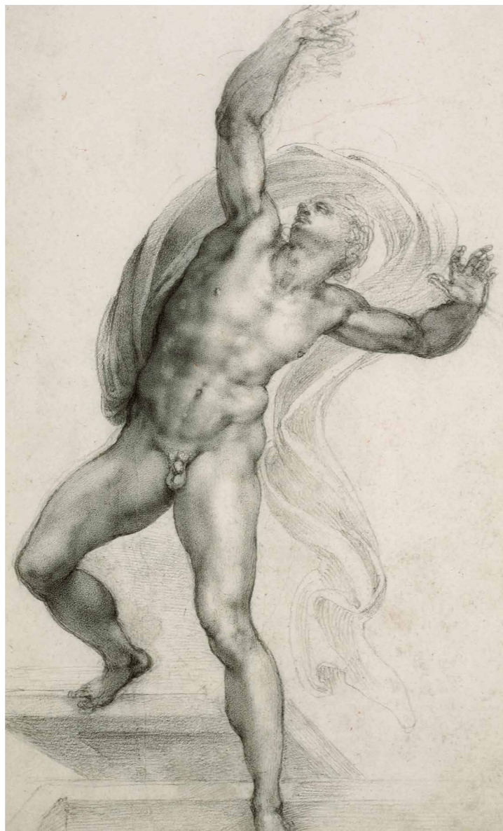
Michelangelo Buonarroti A feltámadott Krisztus, 1532-33 körül, kréta, papír, 37,2×22,1 cm, Royal Collection Trust © Her Majesty Queen Elizabeth II 2019

„Az igazi vizsgálat az élet és önmagunk vizsgálata; a médium csak egy eszköz a kísérletben.” Bill Viola