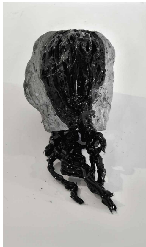
Berszán Zsolt Cím nélkül, 2013, fekete szilikon, beton, 23 × 45 × 20 cm

A fényaura pedig azt jelenti, hogy ezek a testtöredékek világlanak. Világító világmaradványokként arra mutatnak rá, hogy amíg élet lüktet a csonkolt, pusztulásnak indult testdarabban – ha ez az életkarakter már csak a féreg aspektusából ragadható is meg –, addig igenis az emberi létezés, egyáltalán, a létezés tanúsításáról beszélhetünk. A testtöredékek által képviselt tanúsító erő a pusztta élet igenléséből ered, ekként nem értelmezhető a humanista hierarchia és értékrend felől – jelentését kizárólag poszthumán perspektívában nyeri el. Berszán művészete a poszthumán perspektívát nyitja fel.