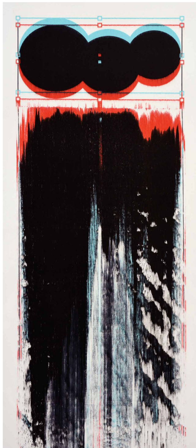
Battykó Róbert Fission, 2018, olaj, vászon, 137 x 60 cm

művészettörténeti áthallásokat is felfedezhetünk. Egyszerre lehet ismerős és ismeretlen érzésünk, ami nyilván függ a befogadó tájékozottságától, feltételezve minimum a 20. századi festészet ismeretét.