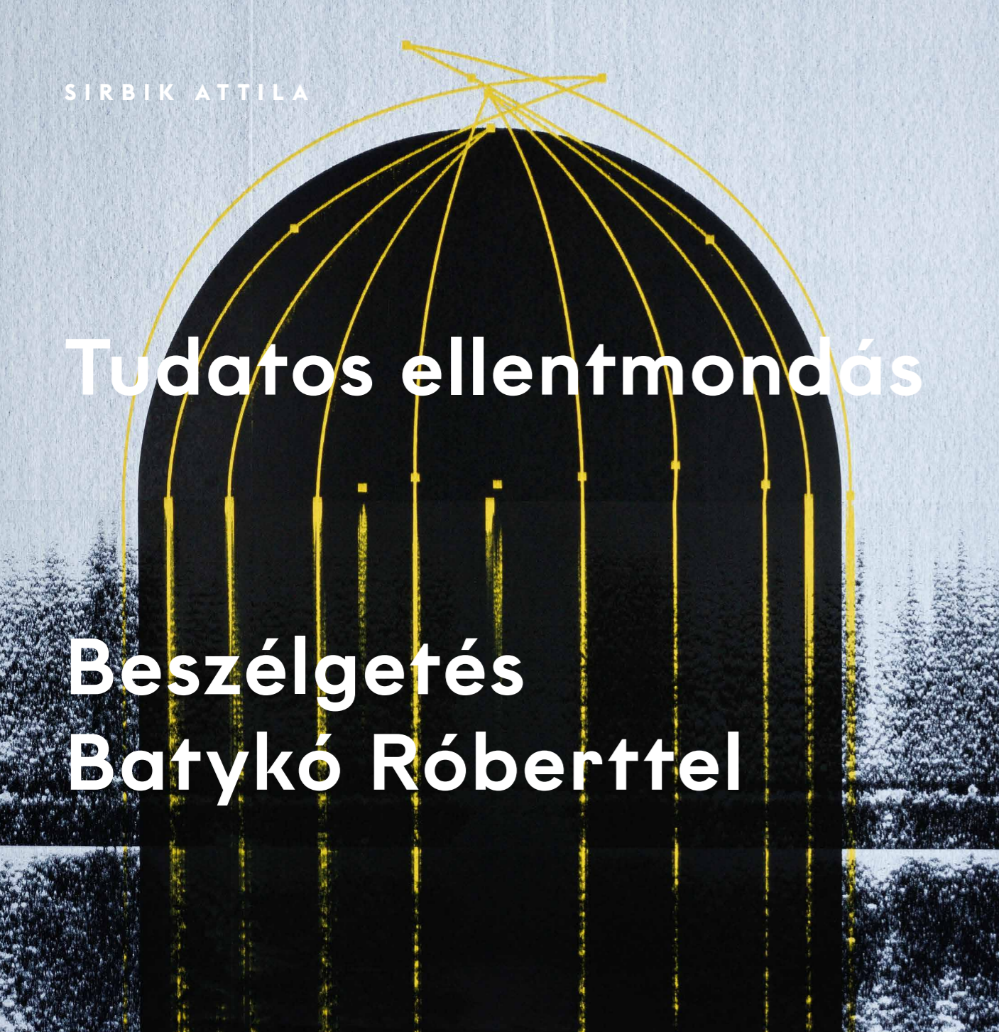
Batykó Róbert Astrodome, 2018, olaj, vászon, 140 × 145 cm

BATYKÓ RÓBERT rendkívül konzekvensen épülő festészeti életművében új lépcsőfokot jelentenek a közelmúltbeli képein megjelenő enigmatikus képterei és rejtélyes kompozíciói. A művész az elmúlt évek során egyértelműen a digitális kódolás hibáiban rejlő poétika és a digitális képfeldolgozás melléktermékeinek festészeti potenciálja felé orientálódott. Új sorozatában azonban már a poszt-digitális festészet alapkérdéseire is reflektál: nem egyszerűen csak a digitális képekhez fűződő viszonyok vizsgálata fontos számára, hanem az is, hogy a korunkra oly jellemző képáradatot – szó szerint – leképezze festményei létrehozásának folyamatában.