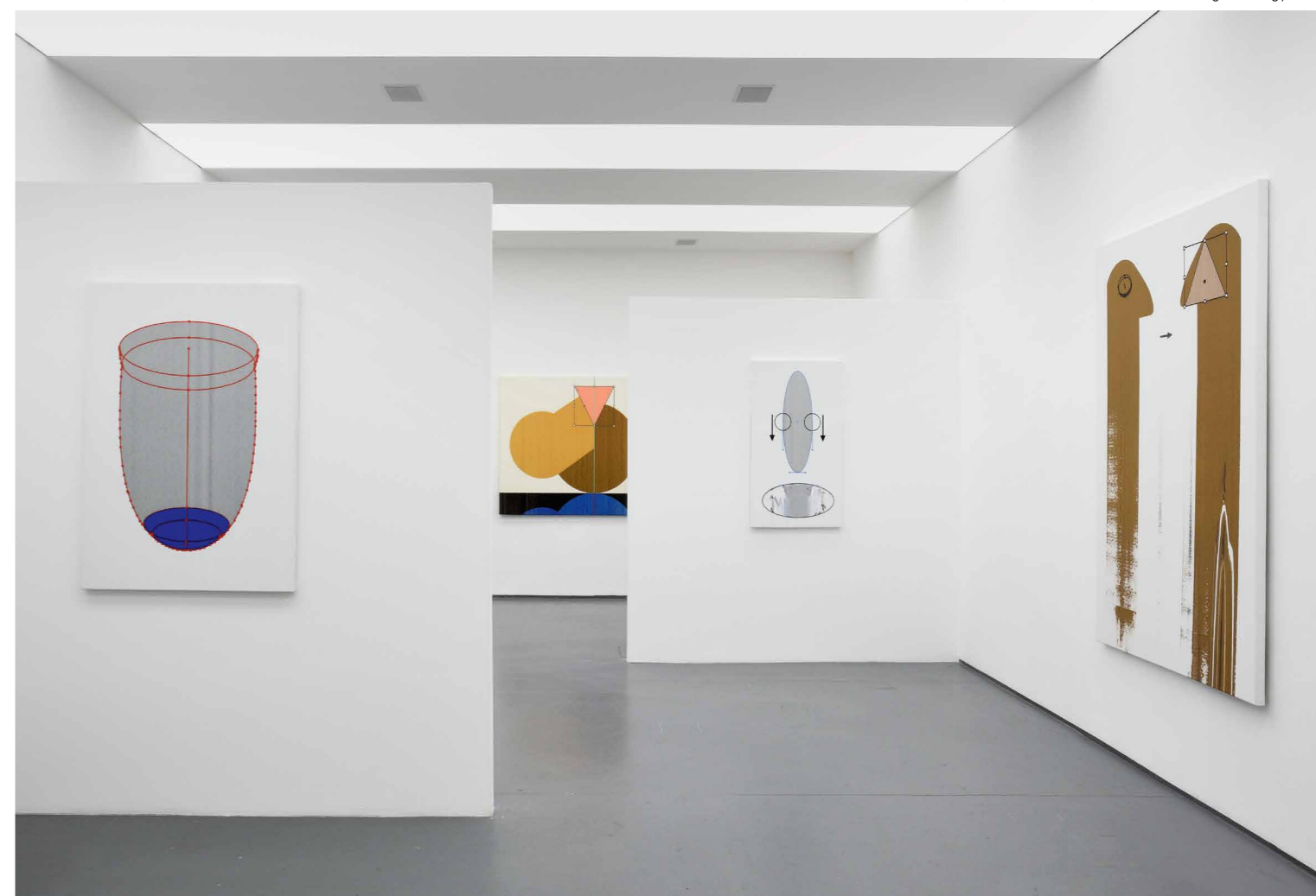
Batykó Róbert Vörös szem, 2019, acb Galéria, 2019

BR: Ezt jól látod, a munkáim valóban leírhatóak a prezentizmus fogalmiságával. Ettől függetlenül birtokában vagyok a festészet és a rajztudás hagyományos eszköztárának, csak ezt már nem használom direkt módon, viszont nagyon fontos alapot biztosít számomra. Régóta dolgozom azon, hogy a festészeti tradíciót újragondoljam, és egy olyan festészeti praxist alakítsak ki, mely képes a mai kor „képiségét” hitelesen megjeleníteni. Ez sok esetben falat épít a befogadó és a műveim közé, hiszen nagyon idegennek és ismeretlennek hathatnak ezek a képek, sokan nem is tudják eldönteni, hogy akkor ezek festve vannak vagy nyomtatva, ami nem csoda, hiszen az ecsetnyomok a kép készítésének utolsó fázisában felszámolásra kerülnek. Ettől függetlenül nem gondolom, hogy a műveim egy elvont térben lebegnének, adott esetben még