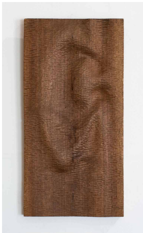
Csiky Tibor Fül, 1968, diófa, 50,2x25,5x2,5 cm

a sorozatot azokban a művekben, amelyeket struktúrájának nevez, s amelyekből három összetartozó művet vés ki: Hullámstruktúra , Mozgásstruktúra és Térstruktúra címen. Mindhárom relief hosszanti, horizontális elrendezésű: egymásra hasonlítanak ugyan, de mind méretben, mind a felületükben valamelyest eltérnek, hiszen nagy gonddal kivitelezett egyedi művek. Míg Moholy-Nagy és Hencze említett sorozatai inkább statikus hatást keltenek, Csiky Tibort éppen a mozgás, a finom, szinte csak árnyalatokban érzékelhető hullámváz vonzotta. Három reliefje ugyancsak sorozatot alkot, de mindhárom mű személyes, hagyományos technikával, véséssel született, nincs bennük semmi gépi, semmi mechanikus. Viszont a művek együttese sorozatként érvényesül leginkább – egymást erősítik, ha egymás fölött helyezkednek el egy kiállítás keretében.