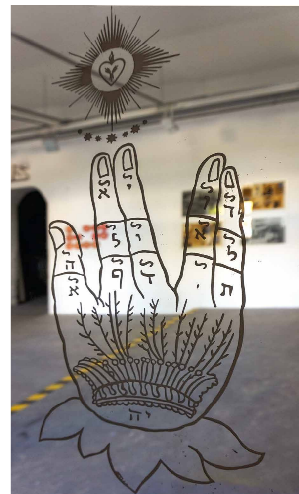
Rácmolnár Sándor Titkos Peszach, 2019, vegyes technika, 56x34 cm