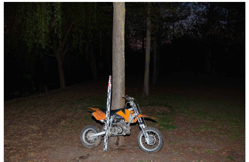
Barakonyi Szabolcs Hűlt hely 8177, 2019

Arab számokkal megvastagítva feketéllenek a fehér műanyagon vagy éppen a szürkés, hideg fémen a bűnjelszámok , amelyek egy-egy helyszínen a tárgyi