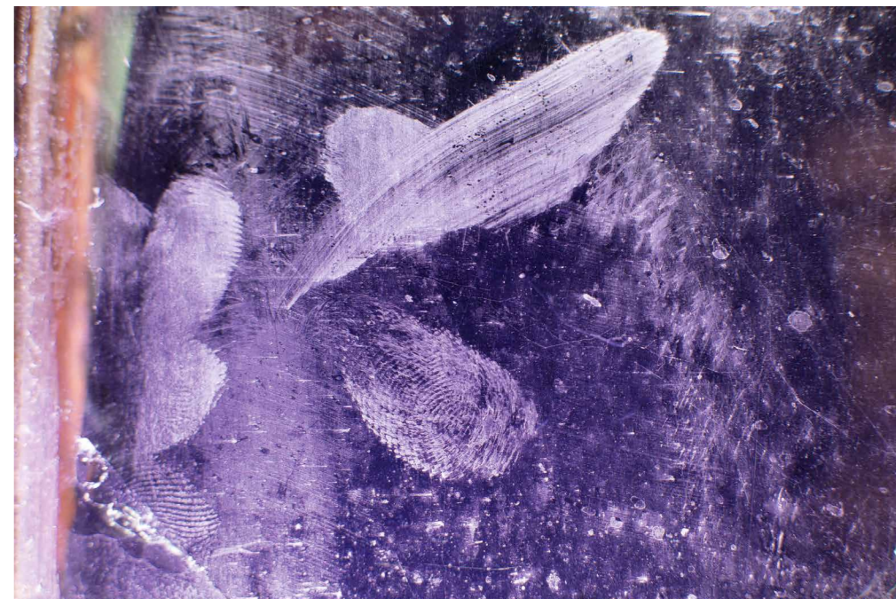
Barakonyi Szabolcs Hűlt hely 0449, 2015

AL PACINO, a Szerelem tengere (1989) című