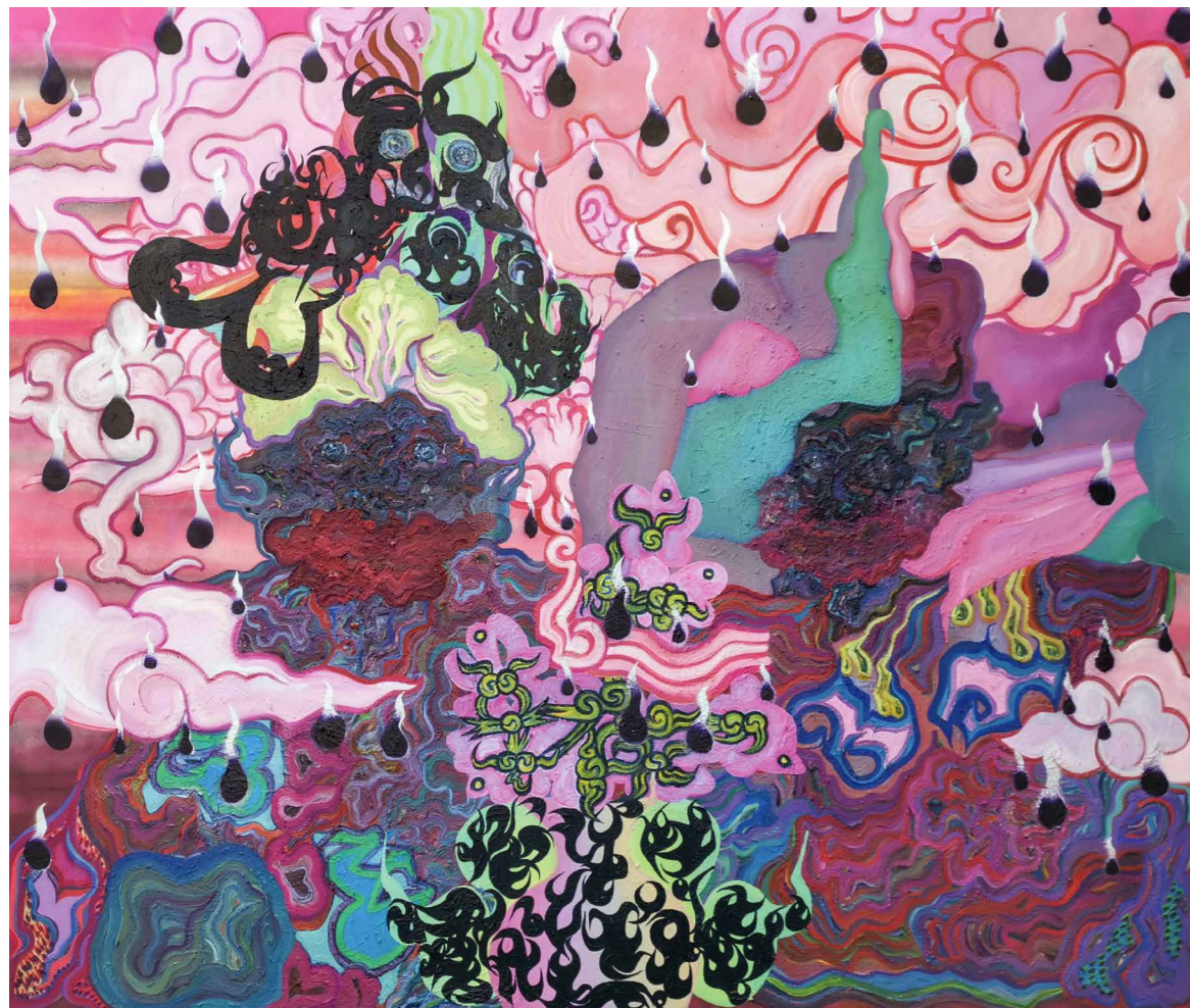
Zuzana Zurbolová Szeret, nem szeret, 2018–19, akril, spray, vásznon, 190 x 230 cm