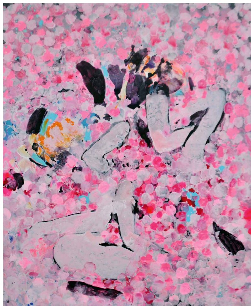
Cserevka Edit The Pieces Broke And The People Wanted More, 2019, akril, vásznon, 180 x 150 cm

tudattalan belső késztetéseinek engedő és a művét magabiztosan kontroll alatt tartó alkotó kettőssége határozza meg. Növekedés versus szabályozottság. A kertész is így jár el: a természetesen kibontakozó, burjánzó életformákat strukturálja, saját koncepciói szerint visszametszi, hierarchiát alakít ki - vagyis komponál. Az alkotófolyamat során az akarat metszőollója a szerves anyagok asszociációját keltő festékekbe vág. A festő narratívát kényszeríti az anyagra. A kép elkészülésének szűk időbelisége, alakulásának krónikája kerül rögzítésre. Amit látunk, az a felülírt kontinuitás és az egymást fékező közlések egy körülhatárolt terepen. A festmény és a gondozott kert analógiáját elfogadva érhetővé válik a kiállítás címválasztása is, mely egyben utalás Octave Mirbeau Kínok kertje című regényére. A kiállítók felfogásában ugyanis az alkotó által teremtett mű - az ápolt kerthez hasonlóan - egyfajta mindenki által megtapasztalható, végtelen vitalitás emberi léptékű darabkája. A kérdés, hogy milyen egyetemes igazságok kényszeríthetők ki az anyagot ért mikrotraumák által, melyeket épp a művész óvó gesztusai gerjesztettek.