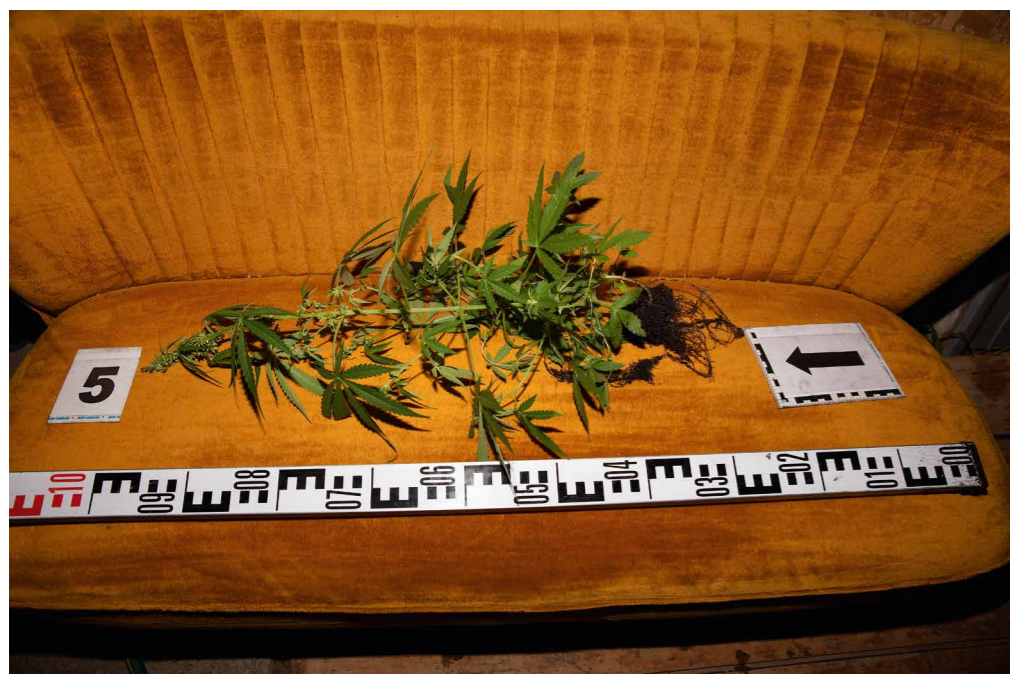
Barakonyi Szabolcs Hűlt hely 9646, 2017

biztosan összeérnek az egymást közvetlen közélről determináló fotók. Az objektívbe zárt valóságsegmensek között több esetben feltűnnek az ajtók, az átjárók fémcsapjai, szerkezetkész formái, amelyek átengedhetnek a befogadót a nyomasztó helyszíni megtekintésből egy új, talán gazdagabb levegőjű helyszínre. Ezek a jövőt szimbolizáló, de mégis ajtózsánérokban megmutató lehetőségek azonban egyértelműen illuzórikusak, így a kriminális lehetőségek esélytelenségének köszönhetően még elgyötörtebbé tudnak válni a bűnügyi helyszínek, vagyis a tapétavággóval körbehúzott valóságok. A befogadót betérítő panorámák mellett az apró, keretbe foglalt, egymásba érő személyi igazolványt jelképező részletek egyidejűsége miatt mondhatta Barakonyi Szabolcs, hogy „olyan az ajánlott útvonal, hogy nem tudod befejezni, ezért vissza kell menned.”