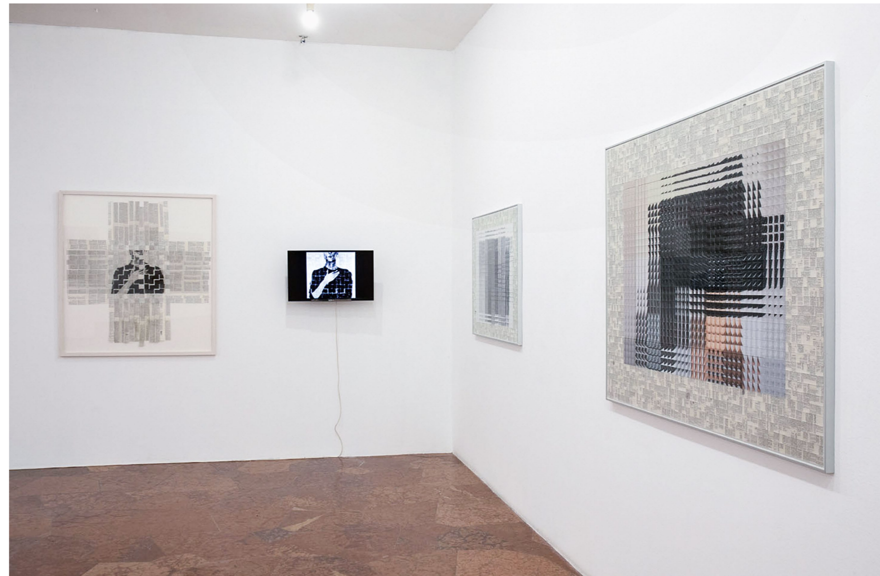
TARR HAJNALKA In Vitro „H”, Kortárs Művészeti Intézet – Dunaújváros; 2020. november 6 – 2021. március 31. részlet a kiállításból

egyfajta tudományos érdeklődéssel tekint a saját testén belül és azon kívül – molekuláris szinten – zajló folyamatokra.