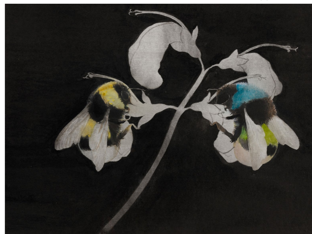
ENZSÖLY KINGA Generációváltás?, 2021, 24×32 cm, tus, akvarell, papír

történik akkor, ha egyszerűen békén hagyjuk a természetet, és teret adunk az élőlényeknek, hogy éljék a – valamennyire az emberek által is óhatatlanul befolyásolt – életüket? A gyakorlatban megvalósítható egy olyan életvitel a Földön, ahol a sokkal kevésbé direkt módon avatkozunk bele a természet folyamataiba. Ehhez azonban vissza kell húzódnunk, ahogy sárga virágos méhes képein Enzsöly Kinga is mint néző teljesen háttérbe vonul: csak a méhecske van, szent létezésében és tevékenyen átlényegülve a virággal. Kis lépés, de fontos példa: annak, aki nem akar annyira, nem valamit, hanem bármit, talán szintén fel fog fényleni az a virág, és ezzel egy új tisztelet ébred benne az iránt, ami van, és amivel ő maga is egységben él.