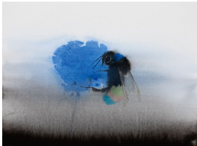
ENZSÖLY KINGA Generációváltás?, 2019, 24×32 cm, tus, akvarell, papír