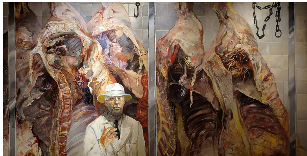
CARLOS ALONSO Carne de primera No 2, 1977 (Magántulajdon. Forrás: http://socompa.info/cultural/carlos-alonso-retratasta-de-la-violencia-estatal/attachment/carlos-alonso-ph-paone0/ )

Bár a kilencvenes években a kormányzat hátráltatta a büntetőeljárásokat, Néstor Kirchner elnöksége (2003–2007) alatt újraindították a pereket, és egyes ítéletek már a népi vádját is elismerték. 18 Az igazságszolgáltatási folyamatban a civil társadalom is meghatározó szerepet játszott, például amikor Mauricio Macri elnök (2015–2019) átalakította a legfelsőbb bíróságot és csökkenteni próbálta egyes emberiség ellen elkövetett bűnökért elítéltek büntetését, az emberi jogi szervezetek által szervezett hatalmas tüntetések képesek voltak akkora nyomást gyakorolni a kongresszusra, hogy módosították a rendeletet a tiltakozók követeléseinek megfelelően. 19