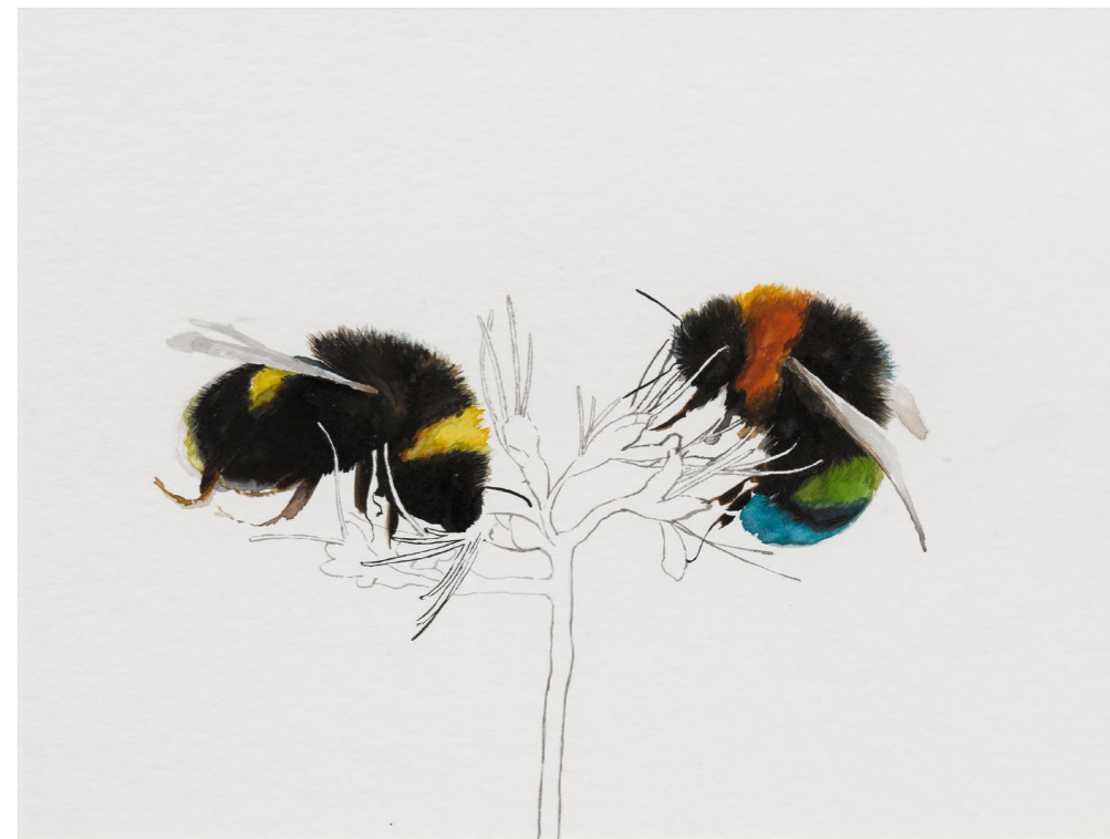
ENZSÖLY KINGA Generációváltás?, 2021, 24×32 cm, tus, akvarell, papír

történik akkor, ha egyszerűen békén hagyjuk a természetet, és teret adunk az élőlényeknek, hogy éljék a – valamennyire az emberek által is óhatatlanul befolyásolt – életüket? A gyakorlatban megvalósítható egy olyan életvitel a Földön, ahol a sokkal kevésbé direkt módon avatkozunk bele a természet folyamataiba. Ehhez azonban vissza kell húzódnunk, ahogy sárga virágos méhes képein Enzsöly Kinga is mint néző teljesen háttérbe vonul: csak a méhecske van, szent létezésében és tevékenyen átlényegülve a virággal. Kis lépés, de fontos példa: annak, aki nem akar annyira, nem valamit, hanem bármit, talán szintén fel fog fényleni az a virág, és ezzel egy új tisztelet ébred benne az iránt, ami van, és amivel ő maga is egységben él.