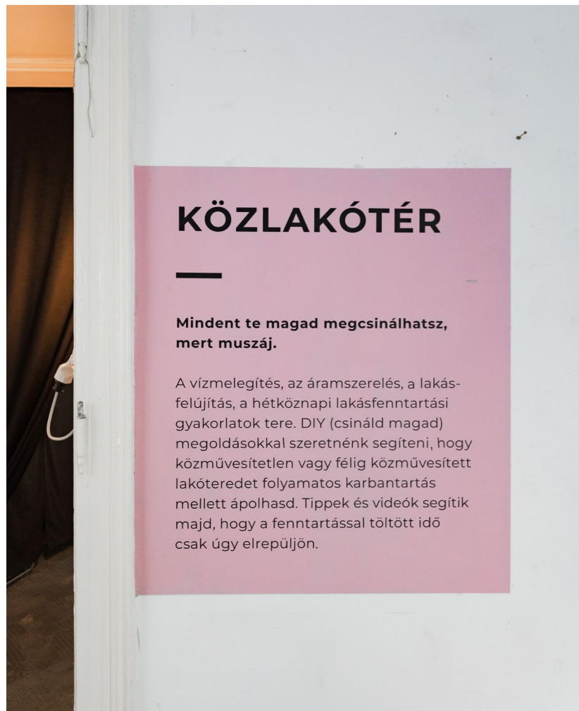
PAD Hétköznapi hiánycikkek, részlet a kiállításból