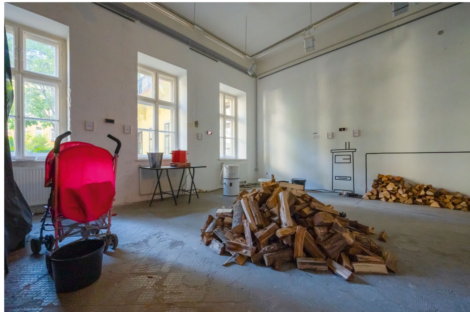
PAD Hétköznapi hiánycikkek, részlet a kiállításból

aktívan értelmezik a társadalmi és politikai jelenségeket. A Közlakótér installációjában a prezentációs videók töltenek be hasonló szerepet, melyekben a saját környezetükben látható interjúalanyok személye hitelesíti a kiállítási helyzetet, ugyanakkor élesen rámutatnak a valóság és a modell közti különbségekre is. A videók erőssége, hogy az interjúalanyok rutinos és gyakorlatias magyarázataiknak köszönhetően a téma szakértőiként jelennek meg.