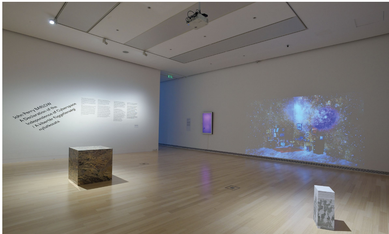
JAN ROBERT LEEGTE: Google térkép mint szobor / Google Maps as a Sculpture, 2017, archív nyomtat, plexi, akril, dibond, 80×80×80 cm | OLAWUYI RÓBERT: Kirekesztés / Exclusion, 2017 3D animáció, kijelző, ablakkeret, 122×75×12 cm | LAUREN HURET: Prófeciák a nooszféráról / Prophecies of the Noosphere, 2019, 4k videó, 2' | ALEKSANDRA DOMANOVIĆ: Grobari, 2009, kupacba halmozott, szegély nélküli tintasugaras nyomatok, 120 grammos papír (3500 oldal), 35×21×29,7 cm © Fotó: Rosta József | Ludwig Múzeum – Kortárs Művészeti Múzeum