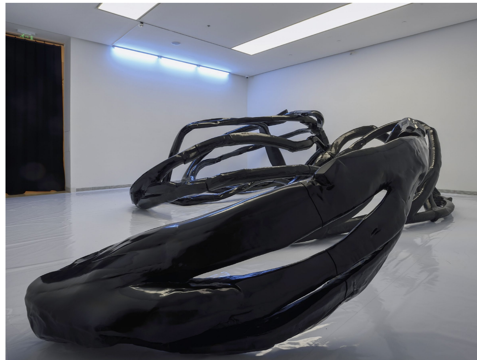
ANDREJ ŠKUFCA: Feketepiac: ógb végkifejlet / Black market: ógb ending, 2021, poliuretán, poliészter, akril, alumínium, változó méret