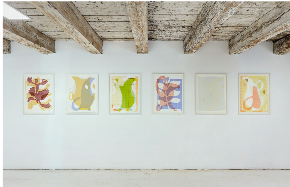
ULRIKE MÜLLER monotípiái, When Art Meets Society | When Society Meets Art , 2021, aqb Project Space, Budapest