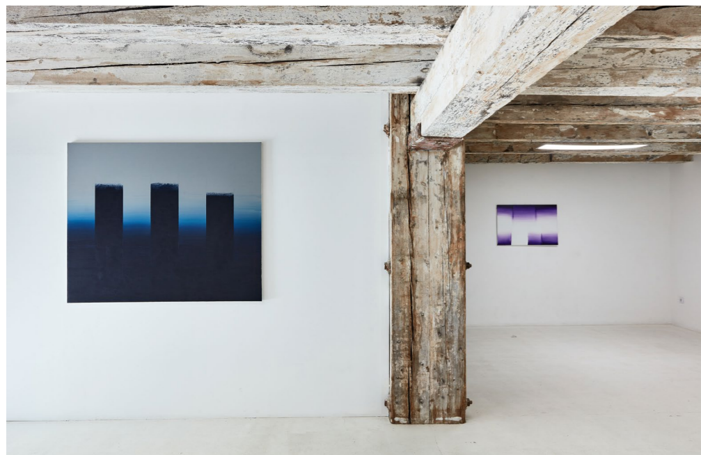
Kiállítás részlet AGATA BOGACKA festményeivel, When Art Meets Society | When Society Meets Art , 2021, aqb Project Space, Budapest

egymásba olvadó felületek párbeszédére, amelyek mindig helyzetek, szituációk, kapcsolatok, érintések és érintkezések leképeződései, mindamelllett, hogy olykor tárgyias asszociációkat is keltenek. Az osztott képernyők látványát idézik – vagyis az egyre virtualizálódó emberi interakciók imaginárius tereinek adnak testiesen érzéki formát – különös, képzeletbeli tájak, arcok és testek maradványai, egy egyszerre virtuális és érzéki univerzum helyzetképei, amelyek szintén értelmezhetők az absztrakció művészettörténeti hagyományainak a kortárs vizuális kultúrán átszűrt újraértelmezéseiként, sajátosan párosítva a személyes az univerzálissal. A modernista absztrakció hagyományai sejlenek fel ULRIKE MÜLLER alkotásain is. A festményeken, szőnyegekben és grafikákon az absztrakció univerzális formái gyakran találkoznak stilizált tárgyias motívumokkal, amelyek asszociációk széles köre felé nyílnak meg. Müllert, akárcsak Bogackát, nem pusztán az absztrakció és a figuráció, illetve a modernista formaképzés, a digitalitás és a festészeti hagyományok kapcsolata foglalkoztatja, hanem a tesztaszatlatok és az ezekkel szorosan összefüggő nemi identitás kérdései is, amelyek kódoltan-burkoltan épülnek bele a művek rendkívül gazdag textúrájába. A textúrába, amely felfüggeszti, vagy legalábbis egy pillanatra megakasztja a virtuális képek áramlását. Matriális formát ad az anyagtalannak, hogy aztán az digitális képként visszakerüljön a végtelen körforgásba, a képek megfogható-megfoghatatlan láncolatába.