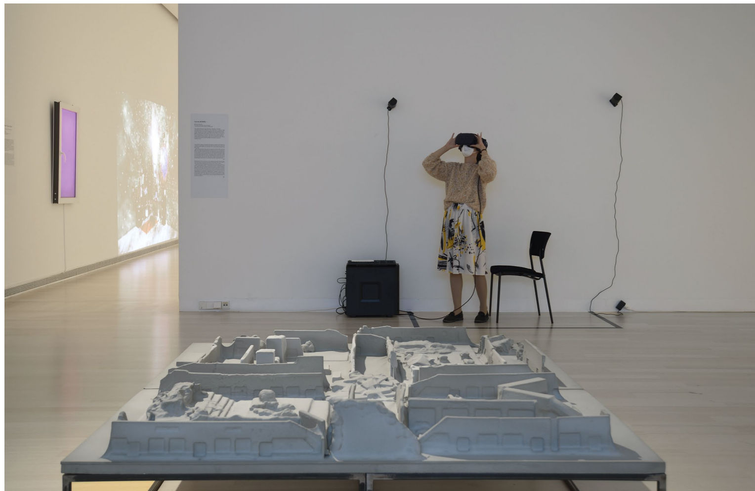
CAROLA BONFIL: Franz Kafka A Kastélyának vég nélküli vége, 3412 Kafka – Első fejezet / The Infinite End of Franz Kafka's Das Schloss, 3412 Kafka – First Chapter, 2018 CGI videó VR (HTC Vive Pro), 8'25"; hang: FRANCESCO FONASSI, grafikai tervezés: IMAGO és MILOŠ BELANEC; kivétel, CGI VIDEO 2', loop, hang: FRANCESCO FONASSI, grafikai tervezés: IMAGO; szobor (beton, PVC, 20×180×170 cm)

kiállításá(nak rekonstrukciójá)hoz, mely az absztrakt művek bemutatása helyett elsősorban a festmények közötti térbeli viszonyok vizsgálatára helyezte a hangsúlyt. Izgalmas, a white cube múzeumi terek kánonteremtő szerepét boncolgató munkákkal szerepel a kiállításon STANO MASÁR is, aki az Áthelyezett terek (2012) című sorozatában olyan világhírű múzeumok, mint a londoni Tate Modern, vagy a New York-i MoMA kiállítótereinek egy-egy fal- és padló részleteiről készített, az eredetivel tökéletesen egyező replikákat. Az így létrejövő tér-másolatok egyfajta teleportként is értelmezhetők, melyeknek köszönhetően az azokba belemegyő látogatók – ugyan átmenetileg és átvitt értelemben csupán, de – a rangos nemzetközi művészeti intézményben találhatják magukat. Mind a valós, mind a digitális kiállításnak fontos aspektusa az interaktivitás , a különféle fizikai és virtuális terekben mozgó és változatos tevékenységeket folytató ember beavatkozása, bekapcsolódása a művek