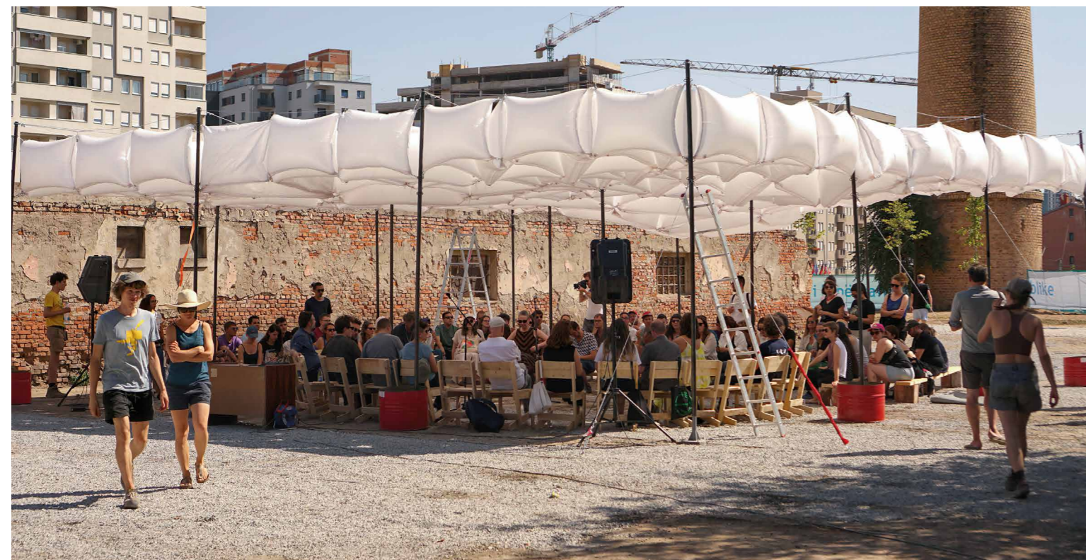
RAUMLABORBERLIN KOLLEKTÍVA Kerekasztal-konferencia a Brick Factory jövőjéről

igazítsa. A Manifesta komolyan vette közvetítő szerepét és a hangsúlyt a potenciális partnerek összekötésére és szakmai párbeszéd elősegítésére helyezte. A biennále innovatív karaktere pedig azon törekvéseben is megnyilvánul, ahogy a korábbi kiadások tanulságait megpróbálja beépíteni a működésébe. A kritika megfogalmazása előtt érdemes azt is figyelembe venni, hogy a rendelkezésre álló idő és anyagi keretekhez mérten – az igazgató, HEDWIG FIJEN szavaival élve 9 –, a Manifesta egy „inkubátor vagy katalizátor” szerepét tudja elsősorban betölteni. A vasútvonal menti zöldesítés vagy a használatra alkalmas közterek jelképes kijelölése szimbolikus gesztusok, amelyek szó szerint láthatóvá teszik a városban rejlő lehetőségeket.