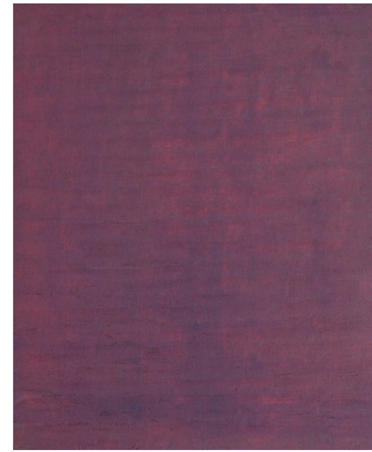
George Meertens Vörös Föld, 2023, olaj, vászon, 60 × 50 cm