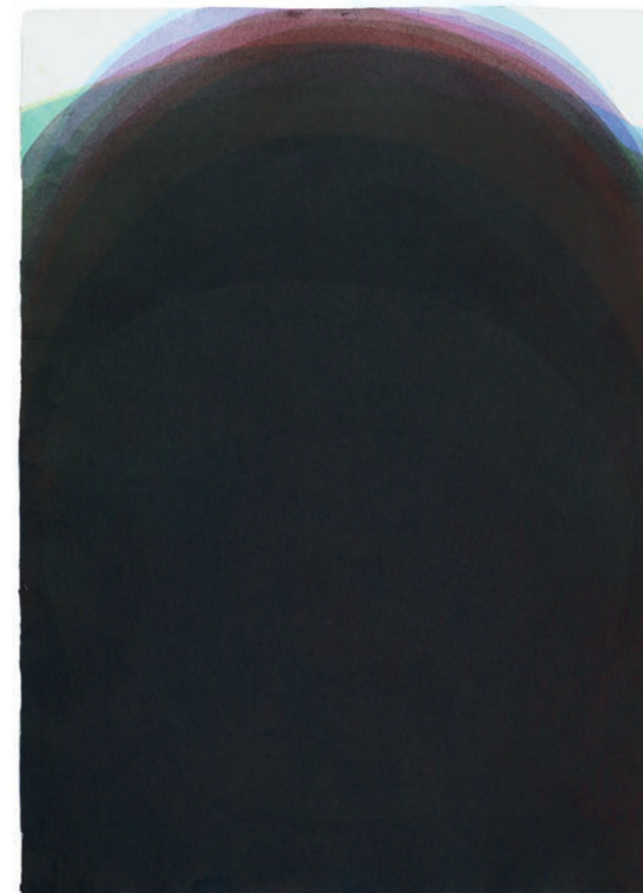
Veres Ágota Testi burkok 01, 2023, akril, merített papír, 84×60 cm

Ha a címben a szelet kicseréljük levegőre, a megnevezés a világ négy, arisztotelészi építőelemére változik. Az itt kiállított munkákban valóban a világ és a természet elemeibe, sőt, ezek belsejébe hatolhatunk. Az absztrakció olyan szintjére lépünk, ahol a magunk titkos, zárt, belső világát is felfedezhetjük.