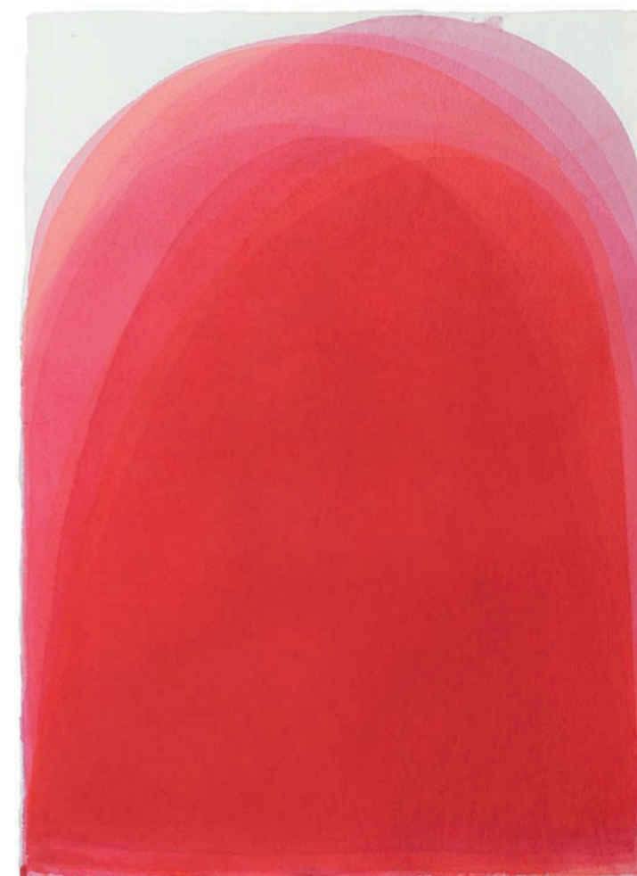
Veres Ágota Testi burkok 04, 2023, akril, merített papír, 84×60 cm

Olyan képi világot mutat be az alkotópáros, amely egyszerűségében mond radikálisan ellent a mai, kusza, túl színes, túlmozgásos, információk özönével terhes külvilágnak. Ha bármelyik kép előtt megállunk - kizárva a közönség, a terem zsidongását, azaz magunkra maradunk a művel - bepillantunk egy láthatatlan ablakon, nemcsak a képbe, a rétegek közé, a mélyükbe, hanem egyúttal a két festő világába is. És a rétegek mélyén megtapasztaljuk e világ zenéjét, felfedezhetjük titkait. Nekem itt - talán nem véletlenül - Erik Satie Gnossienne című zongoradarabja jut eszembe, amely olyan, mint egy utazás az abszolút intimitásba. Hallgatjuk, anélkül, hogy az idő múlására gondolnánk, és amikor előről kezdjük, újra és újra elámulunk rajta.