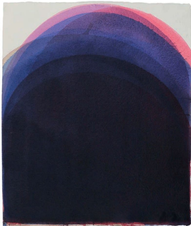
Veres Ágota Testi burkok 05, 2023, akril, merített papír, 70 × 63 cm