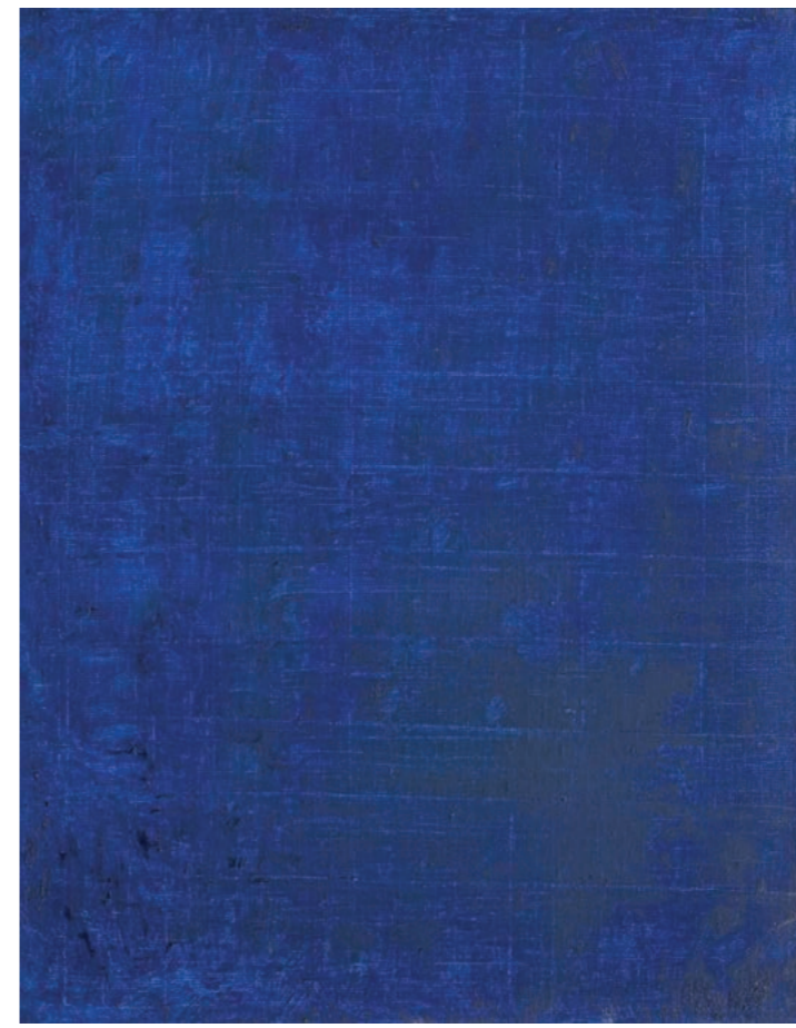
George Meertens Vízszint, 2023, olaj vászon, 50 × 40 cm