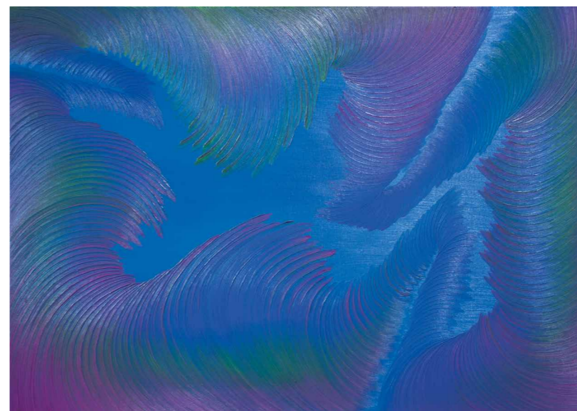
Bernát András Tér tanulmány No. 646, 2021, olaj, vászon, 70 x 100 cm

forrása, titokzatos erők hullámzó östekenője, amelyet mindig a csodával fog összefüggésbe hozni, ahogy ezt Bernát legfrissebb munkái is bizonyítják. Mivel festőkről beszélünk, ráadásul a mostani kiállításuk konkrétan víz-tematikájú/víz-fogantatású, a fenti életrajzi mozzanatok, azt hiszem, semmiképp sem elhanyagolhatók.