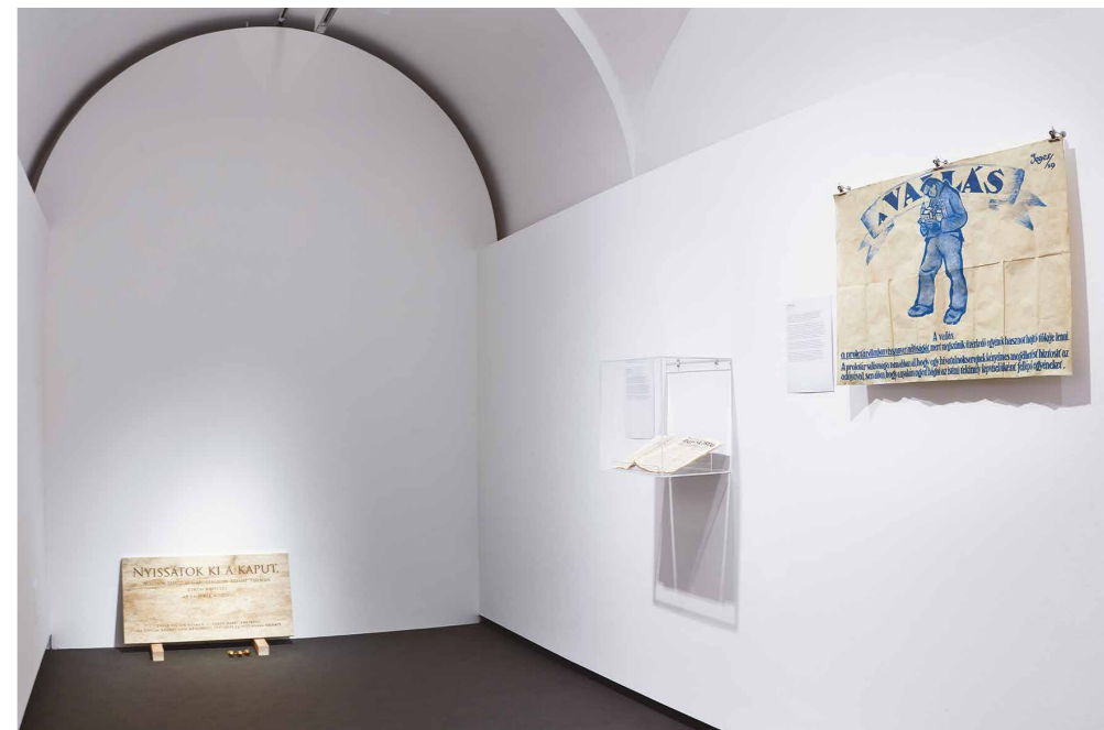
KissPál Szabolcs Nyissátok ki a kaput! részlet a kiállításból

KPSz: A hívószó a „vendégségben” volt, hozzáférést kaptunk az apátság archívumához. Elkezdtem olvasgatni, és közben az interneten is keresgélve, belefutottam