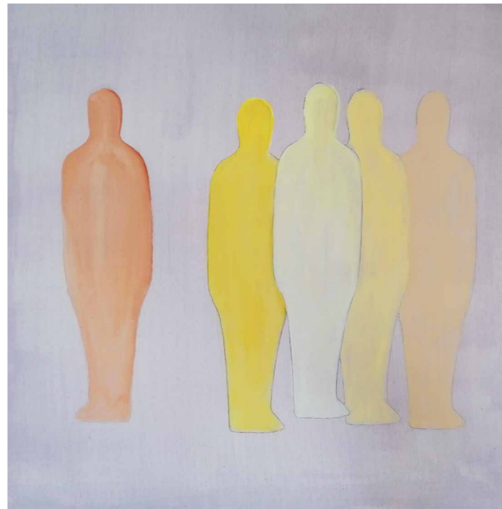
Láng Eszter Különállás , 2021, akril, vászon, 60 x 60 cm