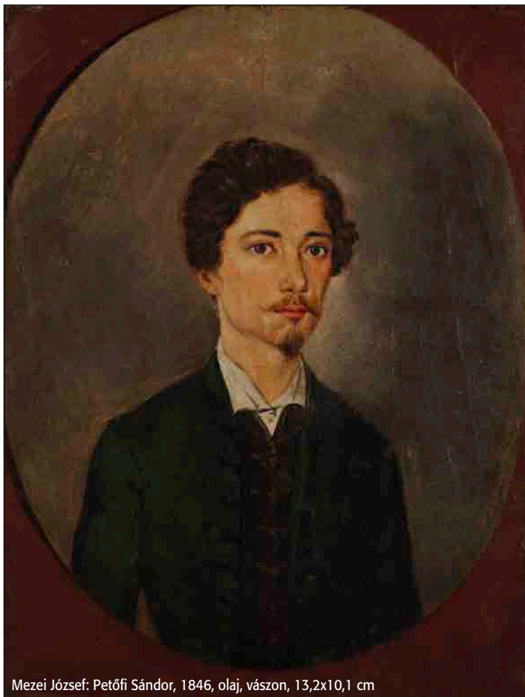
Mezei József: Petőfi Sándor, 1846, olaj, vászon, 13,2x10,1 cm

Mezei Józsefre, az elfelejtett negyvennyolcas festőre régi barátom, Nagy Gyöngyvér csíkszeredai muzeológus hívta fel a figyelmemet. Adatokat gyűjtött Muhi Sándor művészettörténész számára, aki monográfiát írt Petőfi egyik első portréjának piktoráról, s azért fordult hozzá, mert megtudta, hogy Gyöngyvér Mezei leánytestvéreinek a dédunokája. Asszonynéiről kérdezett a muzeológus – így lett főszereplője ennek a mostani írásnak Szűcs Zsófia, Jókai Mór: Budapestnek emlékül című kötetem epizód szereplője.