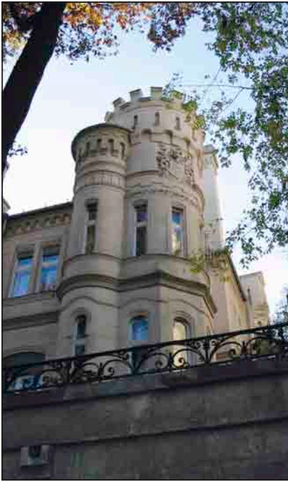
A szecessziós Sacellár kastély ősfás parkban áll