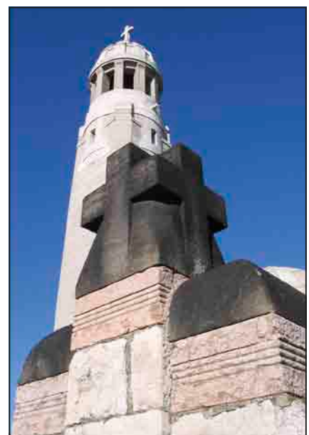
A Törley család szeccsiósi mauzóleuma (1909)