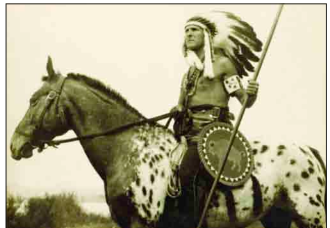
Baktay Ervin nagybátyja, Hopp Ferenc Ázsiai Művészeti Múzeum