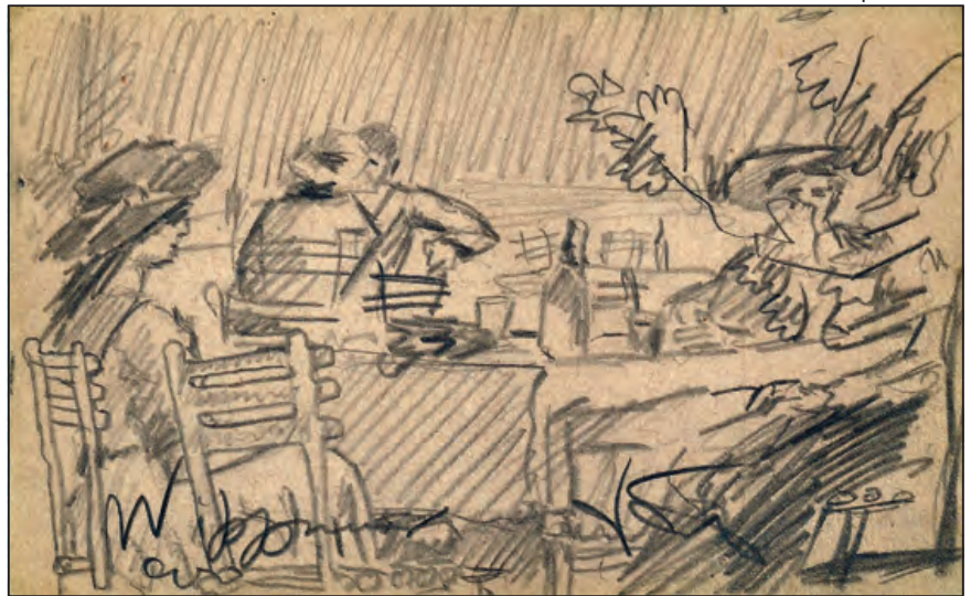
Váradi Albert eredeti rajza a Wippner vendéglőről (postai levelezőlap, 1920.)

lője és kávéháza, Húvösvölgy, Telefon: Pesthidegkút 10.” A képen jól látható a hétvégi vendégáradatra felkészülten várakozó 12 fős személyzet és az öttagú cigányzenekar.