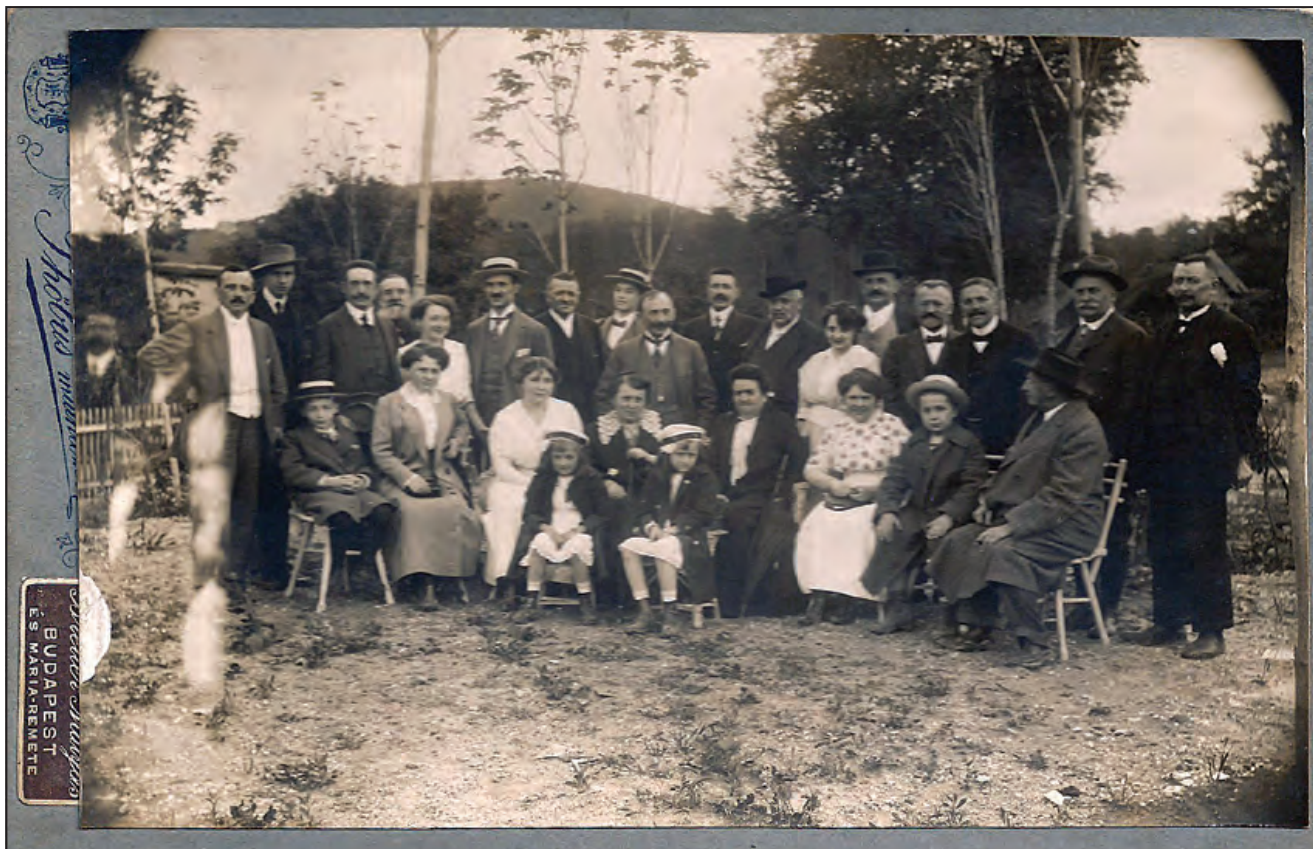
A Phöbus műterem fotója a kiránduló társaságról 1910-ből

A meleg mindenkit szinte „kihajt” a nagyvárosból. Gyerekkoromból legalább is arra emlékszem, hogy ha nem nyaraltunk, ilyen jó időben akkor is kimentünk szabadnapon, hétvégén a környétegből a hegyek közé – sokszor Hűvösvölgybe, bár az nagy utazás volt az Egyetem tértől, ahol laktunk. Jólesett a hűsőbb levegő, és jó volt látni, hogy más családok és társaságok is kijöttek a frissen csapolt sör és a hozott szendvicsek, illetve a budai erdők vonzásának engedve. Most néhány hajdani képet mutatok a Hűvösvölgy körzetéből, ahol hat-nyolc jól működő, teltházias vendéglő is jelzi a környék akkori vonzerejét.