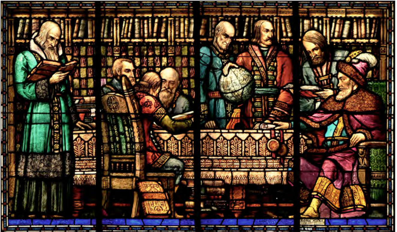
Bethlen Gábor tudósai körében. Marosvásárhelyi Kultúrpalota. 1913.

dal később írt könyvének sorain is átsüt a csalódás, hogy a Mátyás templom ablakait nem ő festhette meg.