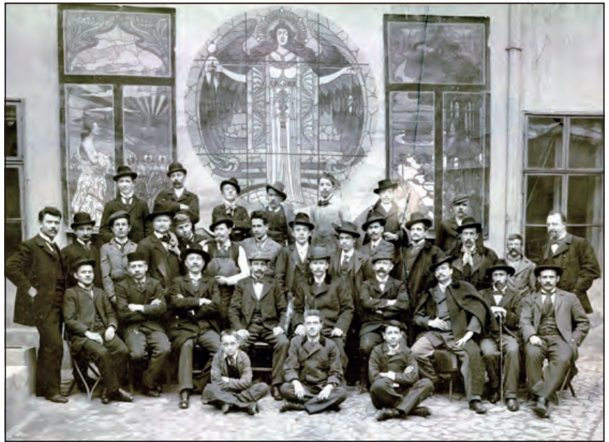
Az „üvegfestőgyáros” munkatársai 1900-ban, a Kender utca 24. szám alatti műhely udvarán