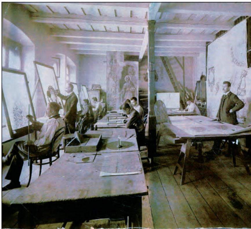
Róth Miksa műhelye a Nefelejcs utca 26-ban (1912 körül)

Míndez számtalan megrendeléshez, valamint Ferenc József-rendhez juttatta. Emellett életre szóló barátságot kötött Alpár Ignáccal (1855–1928), aki később az általa tervezett pénzpaloták sorába rendelt tőle szecessziós stílusú ablakokat.