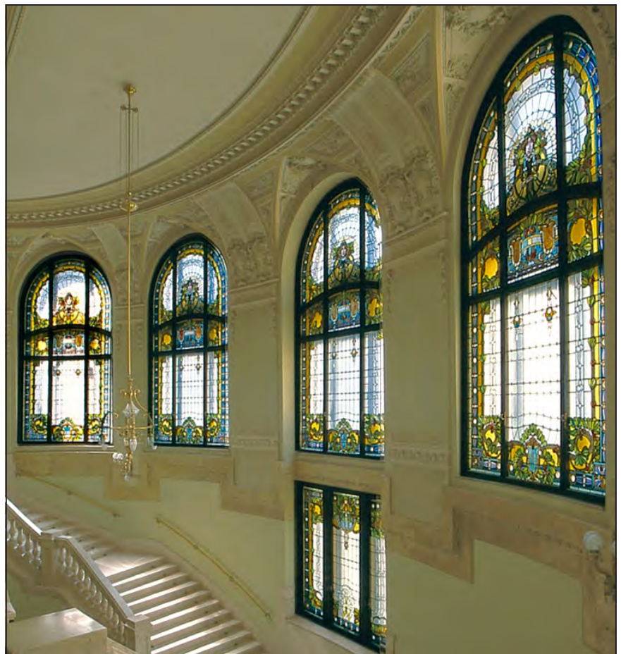
A Nemzeti Bank lépcsőház díszablaksora 1915.

Kárpótolta azonban, hogy Steindl Imre (1839–1902), a gótika legelkötelezettebb hazai híve és ismerője a Vas megyei Máriafalva gótikus templomába tőle rendelt ablakokat. A találkozás meghatározó jelentőségű volt Róth számára, Steindl az építészettörténeti tanszék professzora tanítványává fogadta: „ Alig voltam 22 éves, a mindennapi megélhetés súlyos gondjainal küszködve (amikor Steindl – F. T.) a tanító-mester jóságos lelkével (...) órákat töltöttem el velem tanszékének könyvtárában, hogy a középkori üvegfestészet remekeit velem megismertette, azokból tanuljak és okuljak. ” Talán nem tévedés azt mondani, hogy Róth eddig szerette a gótikát, de ettől fogva ismerte és értette is. Steindl segítségével talált rá a kora-középkor szelleméből merítő munkásságának sarokpontjaira, életművét erre alapozta. A mester is meg lehetett elégedve tanítványával, hiszen később szinte minden munkájába bevonta: tőle rendelt ablakokat Vajdahunyad királyi vadászkastélyába, segítette, hogy Róth kapja meg a kassai dóm üvegrestaurálási munkáit és ő festhessen ablakokat a szomszédos Szent Mihály kápolnába, vele dolgoztatott a belvárosi plébániatemplom restaurálásakor, az erzsébetvárosi Szent Erzsébet templom