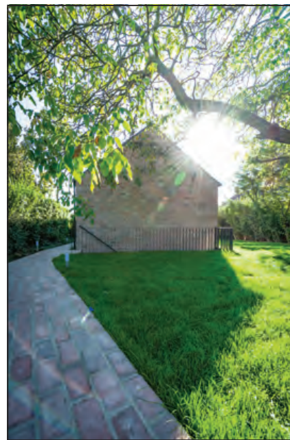
A Hosszú ház különböző nézetekben: a hosszan elnyúló oldalnézet, a völgy felé forduló, déli terasz és az utca felől látható zárt homlokzat

összehozni a formával, hogy minden természetes módon történjen, ne erőltetetten.