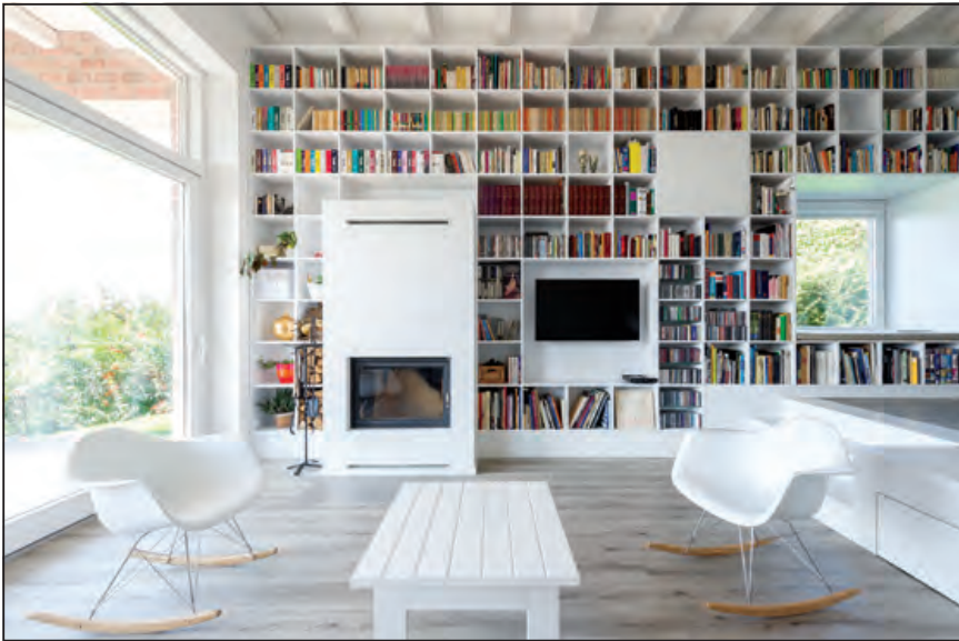
Kandalló, ablak, ülőfülke, tévé, műalkotás és könyv dinamikus kompozíciója

ha-étkező-nappali térhármasán. De még ez sem volt elegendő, ráadásul a nappali mögött maradt még nyolc méter folyosónk. Ekkor jutott az eszünkbe, hogy ha az egész házon végigtolnánk a könyvespolcot, akkor a belső térben is megjelenne egy olyan túlzás, mint ahogy magának a háznak a hossza is az. A folyosót a hasznos funkciók rovására megszücseltük. Ez is, és a könyvespolc végigfutása is felértékeli ezt a teret. Egy 17 méteres könyvespolc azonban akár nyomasztó is lehet, ezért beintegráltunk három ablakot. Az ötven centiméteres falvastagsághoz harmincöt centiméteres könyvespolc-mélység adódott, így a nyílásokban ülőfülkéket tudtunk kialakítani, ahova be lehet kuckózni. Kedvenc helyek lettek ezek. Az ülőfülkék kapcsán is fontos az előképekről szót ejteni, hiszen műemlék épületekben szoktak jellemzően ilyenek megjelenni. A kortárs építészet vissza tud kacsintani történelmi korokba, eszközként használva valamit, ami historikus épületek sajátja volt.