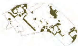
MEGLÉVŐ ÁLLAPOT összes aktív zöldfelület: