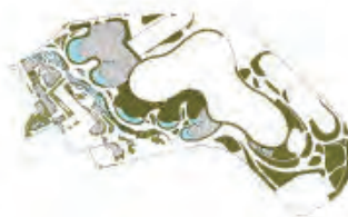
CSAK KÜLSŐ összes aktív zöldfelület: