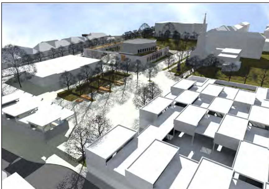
Budafoki Szomszédok Piac, 2015, vezető tervező: Kertész András Tibor DLA / Avant-Garde Építész Stúdió Kft., építész tervezők: Juhász Kristóf, Klopp András, Gál Róbert

Számos fontos tulajdonság, az építészeti döntések helyessége és arányossága csak a használat során derül ki: a látványos fotókról nem minden olvasható le. A Nívódíj pályázat során megszervezett épületlátogatások során például megerősítést nyert, hogy a kiemelkedő alkotások a megbízó és az építész harmonikus együttműködését feltételezik. A díjazott munkák mindegyike olyan épület, amelynek használói mind a tervezés és építés folyamatáról, mind a hétköznapi használatról pozitívan nyilatkoztak. A zsűrit körbevezető emberek, intézményvezetők, a főépítési irodák