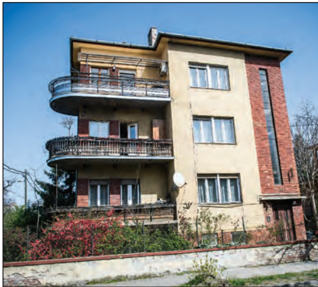
Mexikói út 43.

Ezeknek a lakóházaknak a homlokzatai egyszerűek, vakoltak, esetleg kőlapokkal burkoltak, az ablakok általában keretezetlenek, gyakran tolóablakok. Jellemző motívum a körablak és a csőkorlátos erkély.