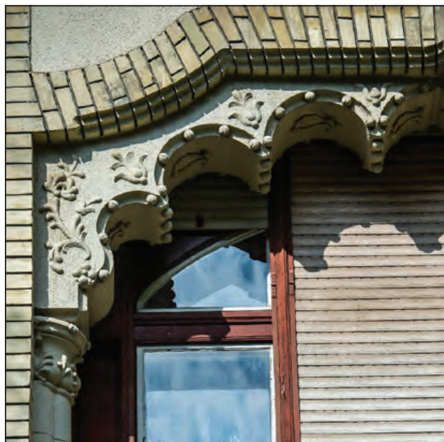
Szabó József utca 23.

A 20. század elején kezdett kialakulni a bérvilla alaptípusa: kert közepén szabadon álló, villa külsejű, egy-két emeletes lakóház, szintenként többnyire egy-egy nagyméretű lakással. Az előző évek művészeti újításaitól megcsömörlött társadalom nagy része építészeti-belsőépítészeti ízlésben az akkori jelenhez képest békésnek és dicsőségesnek vélt múlt, Mária Terézia és a francia Lajosok 18. százada felé fordult. Az 1920-as, sőt az 1930-as