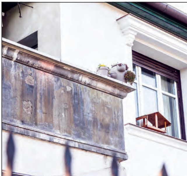
Edison utca 10.

Le Corbusier, a stílus Franciaországban alkotó apostola korai munkásságában három vonulat jelentkezett. A tömeges lakásépítés, az új elveken alapuló várostervezés és az ideális villa vagy magánlakóház problémái foglalkoztatták. Az 1929-1933-as gazdasági válság alatt a modernizmus hivatalos állami, sőt egyházi körökben is először elfogadottá, majd az azt követő fellendülés idején támogatóvá vált. Az 1930-as évek második felében ezzel párhuzamosan a kezdetben szigorú elveket hirdető és eleinte kevés megépült házat felmutató hazai modernizmus megszelídült: