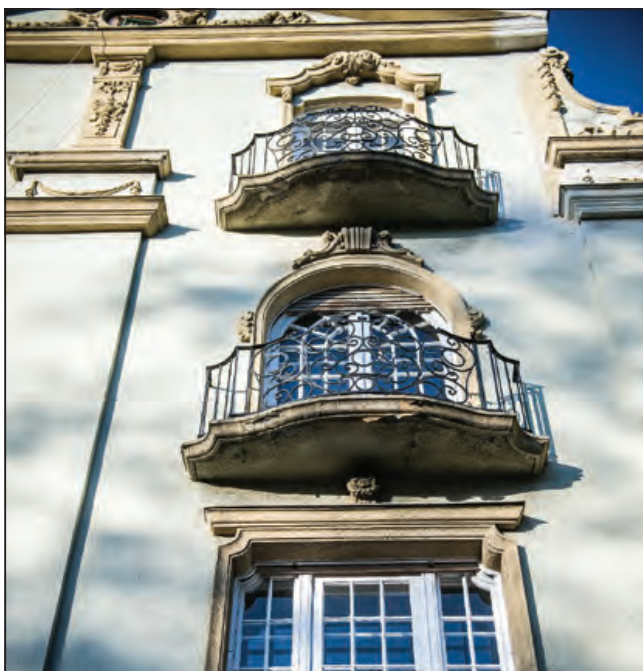
Laky Adolf utca 3.

Ugyanezekben az évtizedekben – 1920 és 1940 között – jelentkezett az art deco stílus Budapesten és Zuglóban is. Elnevezését az 1925-ös párizsi Exposition International des Arts Décoratifs et Industriels című kiállításról kapta, de megjelenésének kezdete korábbra, az 1910-es évekre tehető. Felhasználta a geometrizáló bécsi szecesszió, a kubizmus, a futurizmus és az expresszionizmus elemeit. Egyes változataira erősen hatott az ókori keleti és ősi amerikai kultúrák építészete, de stilizálva a klasszikus hagyomány elemei is tetten érhetők. Születésében közrejátszott az áramvonalas alakzatokkal kísérletező ipari formatervezés is. Az art deco épületeire jellemzőek a háromszög vagy körszelet alaprajzú zárterkélyek, a cikkcakk vonalú párkányok, oromzatok, erkélykorlátok és ablakrácsok. A homlokzattagolás a sík fal-