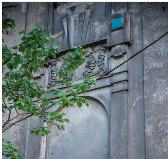
Kövér Lajos utca 32.

A budapesti Műegyetemen 1905 és 1910 között végzett építészek egy csoportjára, a Fiatalokra (többek között Györgyi Dénes , Kós Károly , Kozma Lajos , Jánszky Béla , Mende Valér , Zrumeckzy Dezső ) valamint Toroczkai Wigand Edére és Medgyaszay Istvánra