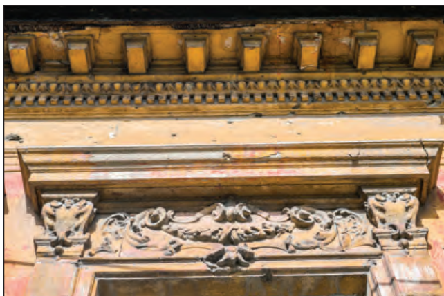
Róna utca 137.

A század utolsó évtizedeiben az erősödő nemzeti azonosság-tudat az építészetben is formai fogódzókat szeretett volna találni. A kísérletezésben Lechner Ödön járt elől. A francia korarenaszansz hatása alatt 1890 körül létrejött épületein a mór és indiai építészeti részletformáit is alkalmazta, a sík felületek egy