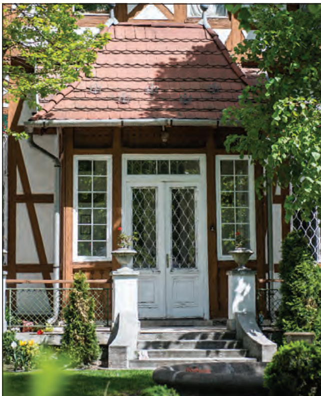
Mexikói út 52/B

di hatások alatt született hazai szecessziós épületek jelentősen eltérhetnek egymástól, aszerint, hogy tervezőjük belga, német, francia vagy osztrák területről vette mintáit.