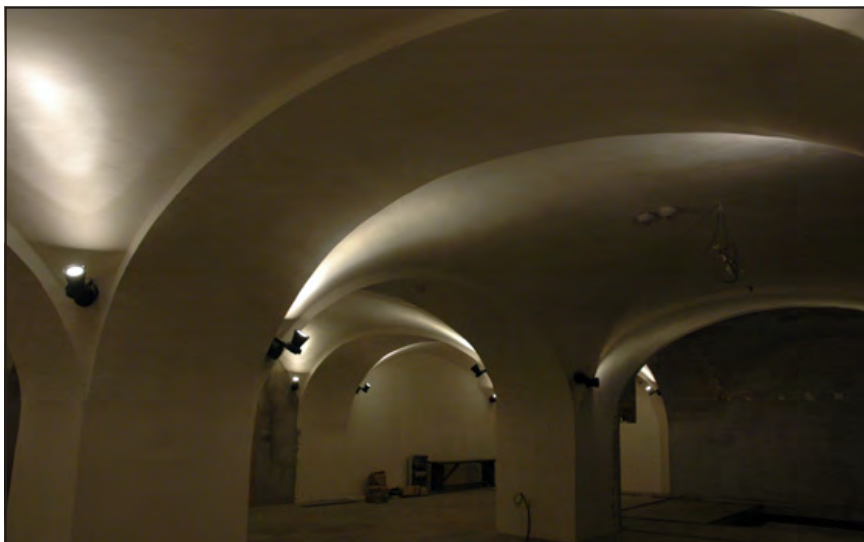
A boltozatos előtér az altemplomban, amelybe a nyugati kapu belső oldaláról lehet lejutni