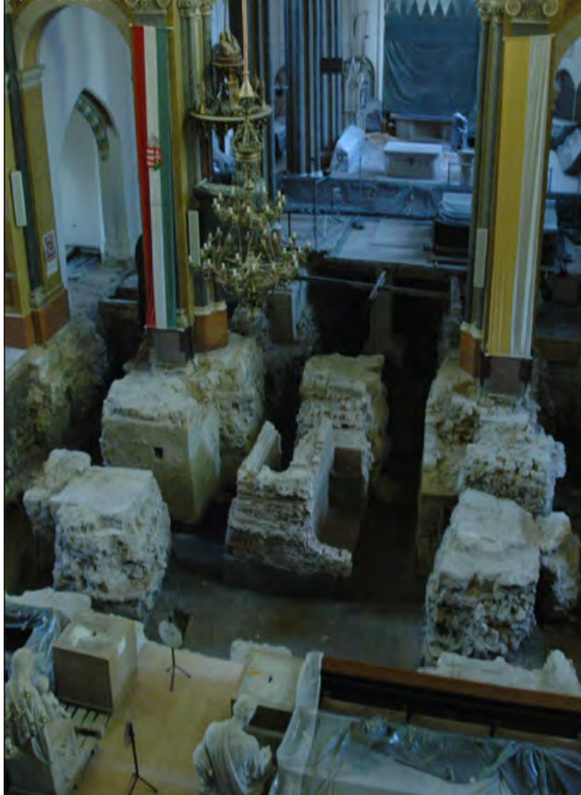
Először a főbejárat felőli, nyugati oldalon bontották ki a padlót, és tárták fel a föld alatti részt