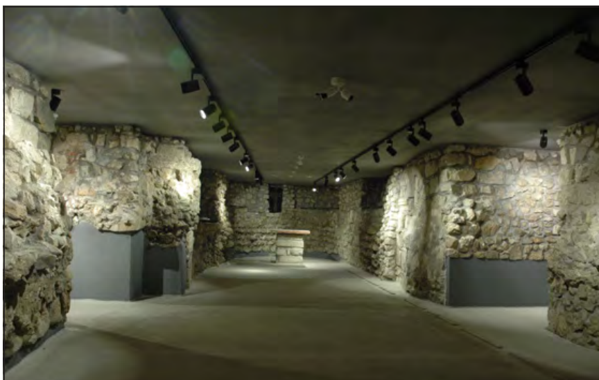
A keleti oldalon kialakított új, miszésésre is alkalmas terület