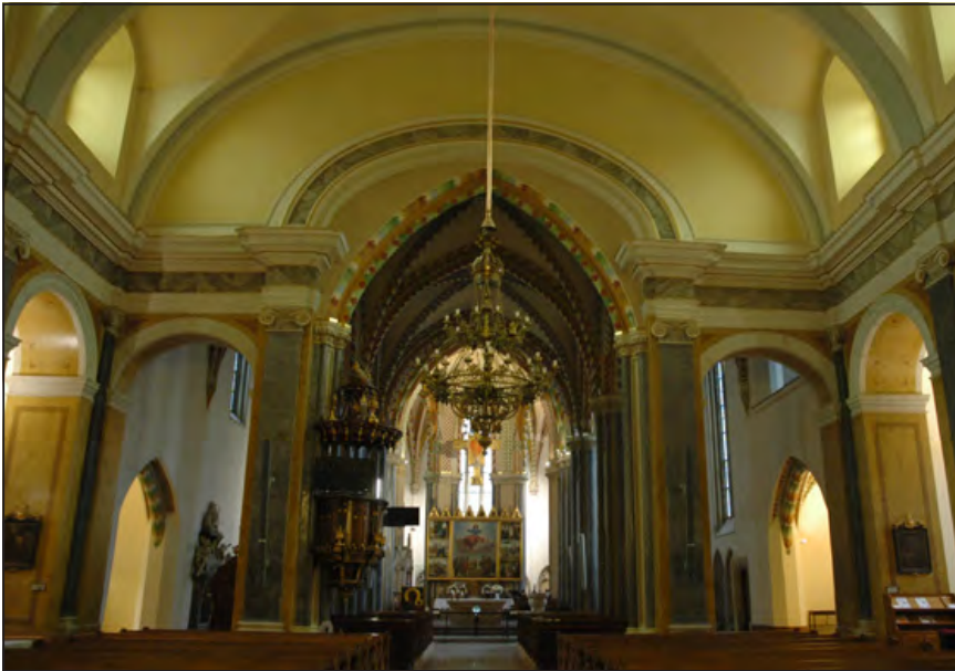
Fotó a felújítás utáni állapotról

és folyamatosan erősít. Adtam egy leírást az életünkről. Szóltam azokról a történeésekről, amelyekre büszkék vagyunk. Arról, ahogyan a magyar kormány kezeli a migráns ügyet, amellyel példát mutat Európának. Említettem az Európai Unió hazug politikájával szemben miniszterelnökiünk realpolitikáját. Ezzel szemben (például) az osztrák kancellár gyalázkodó, hazug magatartása áll. Ő azóta megbukott, de Magyarországtól senki sem kért bocsánatot a valótlan állítások miatt, melyek megítélésünket jóvátehetetlenül torzították, rontották... A dekadens nyugat tanulhat tőlünk, mi most is védjük őket. A tapasztalat az, hogy példánkat, megoldásainkat előbb vagy utóbb követik. Ezek után érdekes volt a tolmács hölgy vélekedése. Megállapította, hogy a francia úr egyre inkább