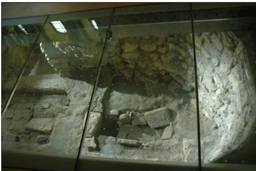
A visszaépített padlóba illesztett üvegezett járófelület alatt megtekinthető a régészeti feltárás meghagyott része