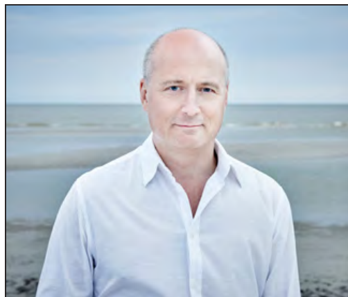
Paavo Järvi.

Tökéletes ajándék lehet a Budapesti Fesztiválzenekar januári koncertsorozata a világjáró észti karmesterrel, Paavo Järvivel és a norvég cselóművésszel, Truls Mørkkel . Järvi tetőtől talpig muzikus – munka közben nézni majdnem olyan szórakoztató, mint meghallgatni a végeredményt. Jelenleg a japán NHK vezető karmestere, de máig sokat tesz az észti zene nemzetközi megismertetéséért. A magyar közönség először hallhatja régi barátjának, Erkki-Sven Tüünek a Sow the wind (Ki szelet vet) című darabját, amelyet Arvo Pärt 80. születésnapjára írt. Truls Mørk Sosztakovics 2. csellóversenyt játsza. A 20. századi gordonkairodalom alapművének számító darabot a szerző 1. csellóversenyéhez hasonlóan Msztyiszlav Rosztropovicsnak ajánlotta. A hangversenyek záródarabja Prokofjev 1947-ben írt 6. szimfóniája, amelyben a II. világháború tragédiáinak állított emléket. ●