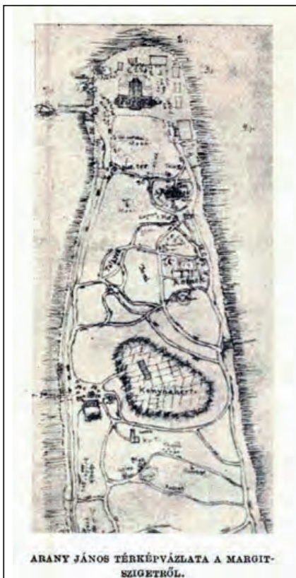
Arany rajza a Margitszigetről, Vasárnapi Ujság (1917)

velét küldi az elnökségnek. Egy évre rá felmentették titkári kötelezettségei alól – példátlan szerénységgel még a nyugdíjáról is lemondott –, és Fraknói Vilmost bízták meg a feladattal.