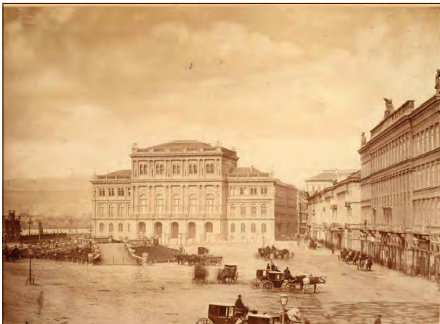
Arany János (1865)