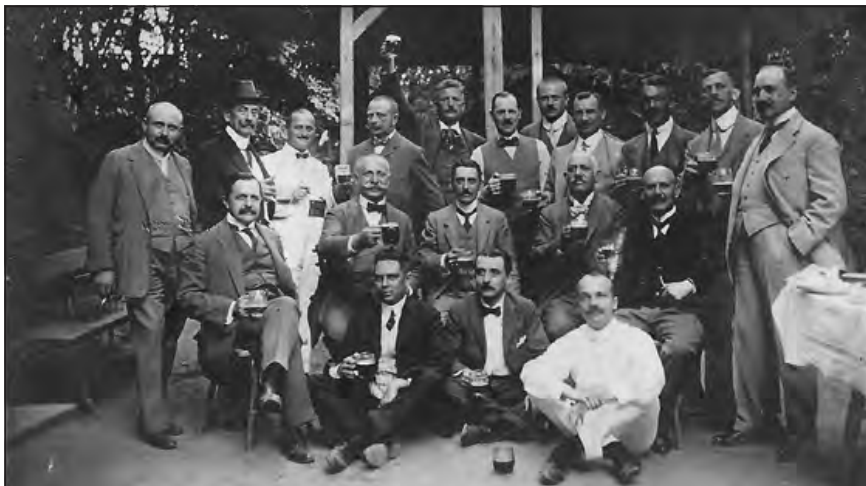
Az Országos Magyar Bányászati és Kohászati Egyesület kuglizó csapata a húszas években