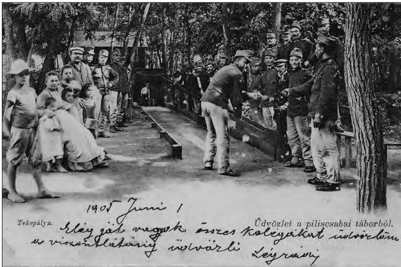
Tekéző katonák a piliscsabai táborban (képeslap, 1905)

dobták, azokat egy „ketreche” zárták és egy rundó italt kellett fizetniük.