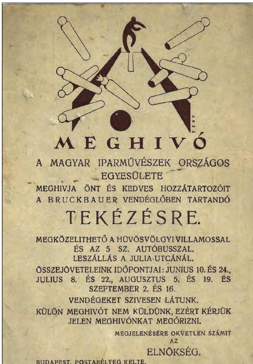
Meghívó tekézésre (1938)