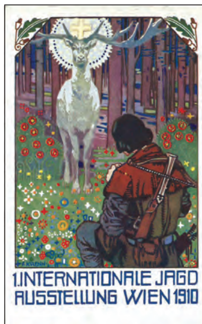
Jagd Ausstellung, Bécs, Magyar Vadászkastély (korabeli képeslap) 1910