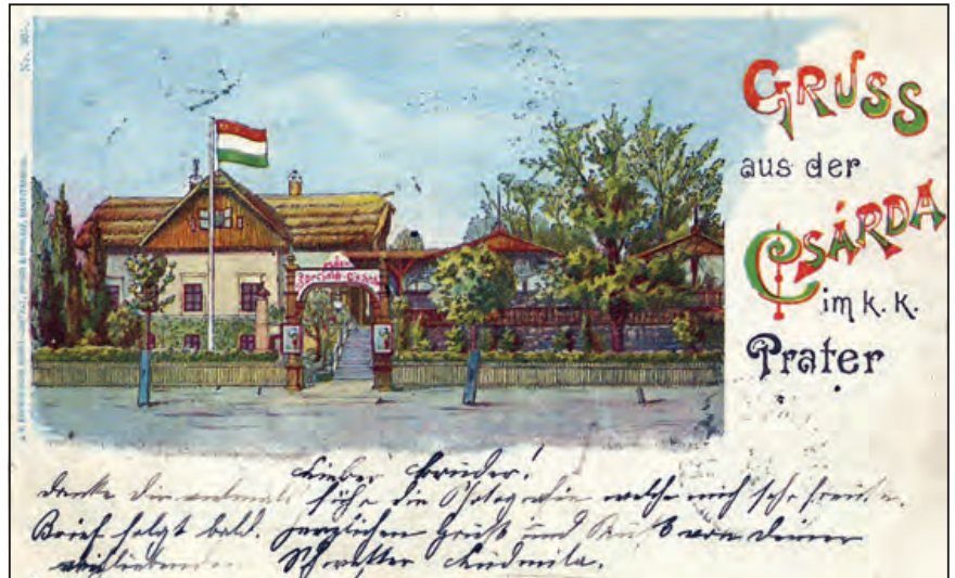
Magyar csárda a bécsi Péterben 1899

Az idegenforgalmi szakemberek a mai napig is sokszor vitatkoznak azon, hogy a külföldön tartott általános vagy szakmai kiállításokon mennyire hasznos és gazdaságos a magyar (nemzeti vagy céges) részvétel. Az újabb időkben a Hungexpo tevékenységét már nem vitták – csak sokszor kritizálták –, de korábban sokan kétkedtek. Az események alatt és után azonban az újságcikkek már rendre „diadalokról” és „látványos sikerekről” számoltak be. Most bemutatunk néhány olyan nemzetközi eseményt, amely hatással volt a hazai idegenforgalomra, a Magyarország és a magyar vállalatok iránti érdeklődés felkeltésére, erősítésére.