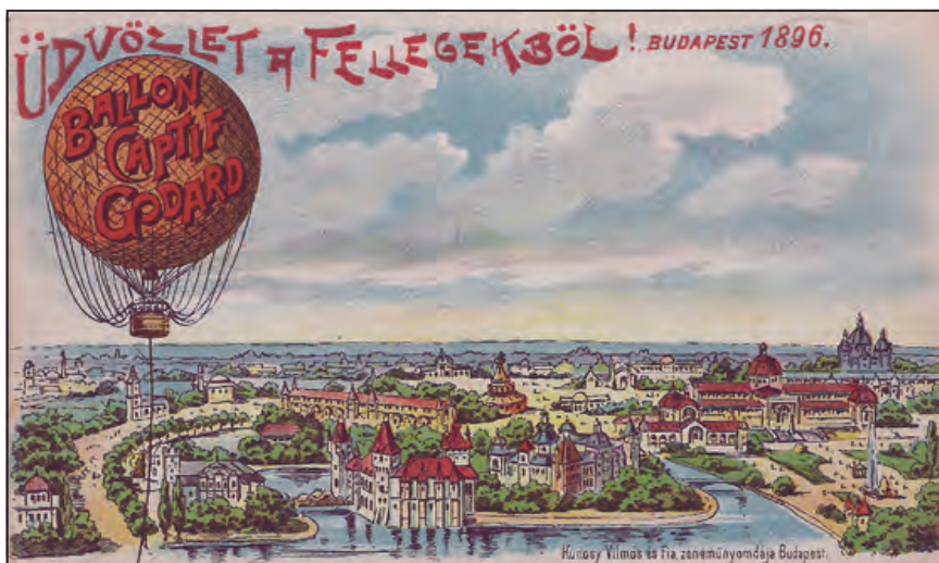
A Millenniumi Kiállítás léghajós plakátja (litográfia-képeslap, 1896)

Az 1896-os eseményekről és a kiállításról rendkívül sok kiadvány, füzet, újságcikk és részletes leírás megjelent. Az idegenforgalmi hatásokról két jellemző momentum: a budapesti szállodák tele voltak vendégekkel, illetve a Vendéglősök és a Kávésok ipartestületei év végi jelentéseikben (az előtte-utána megszokott síránkozások helyett) igen nagy forgalomról számoltak be.