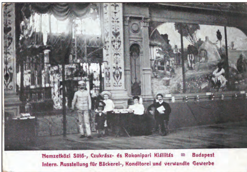
Nemzetközi sütő-, cukrász- és rokonipari kiállítás, Budapest 1907

A mindenki számára vonzó témakör eredménye olyan mértékű hazai és külföldi látogatottság volt, hogy szállodáink és fiákereseink sem panaszkodhattak a forgalomra.