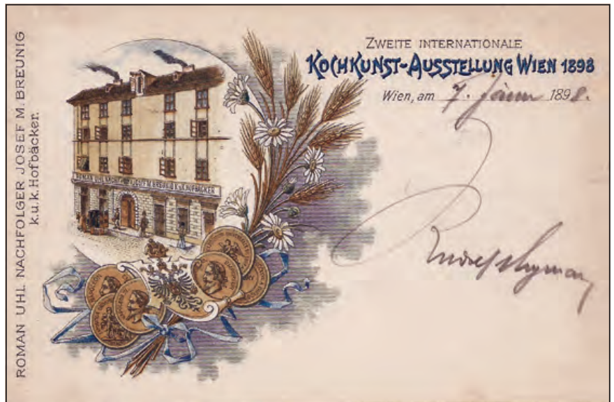
Bécsi Kochkunst Ausstellung (korabeli képeslap) 1898

Az idegenforgalom részeként is jelentős gasztronómiai esemény volt ez a kiállítás, amelyet ez évben már második alkalommal rendeztek Bécsben. Korábban már voltak hasonlók Németországban (Ulm, Stuttgart stb.), amelyeken nagyon sok résztvevő szerepelt, és rengeteg látogatót vonzottak. A bécsi kiállításon a magyar szakácsok (esetenként vendéglők) sikerrel szerepeltek, és sok francia és angol látogató már szállodaszobát is foglalt az ott lévő Budapesti Látogatói Irodában a következő hónapokra vagy évre.