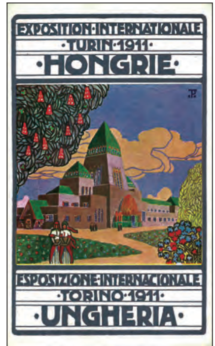
Torinói Világkiállítás 1911 – A magyar pavilon főbejárata (Tőry és Pogány festménye, korabeli képeslap)

Az olasz jubileumra tervezett kiállítás-sorozat római megnyitója 1911. március 28-án volt. A torinói magyar pavilon előzetes jó híre miatt III. Viktor Emánuel olasz király Rómában a magyar pavilonnál nyitotta meg a rendezvény-sorozatot. Később, május 1-én pedig Torinóban az egész kiállítás megnyitó ünnepségét a magyar pavilon előtt tartották, az ünnepi ceremóniára, a fogadásra, a különböző országok diplomata és miniszteriális, elnöki és uralkodói meghívottjainak megvendégelésére pedig a mi pavilonunkban került sor. Az olasz király szavai szerint ez a kiállítás legkülönlegesebb épületének szóló elismerést jelentette, a valóságban azonban hozzátartozik az is, hogy egyedül ez az épület volt készen teljes egészében (és minden részletében) a megnyitó kitűzött időpontjára.