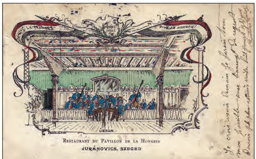
Párizsi világkiállítás – Juránovics magyar éttermének cigányzenekara (korabeli képeslap) 1900

Párizs akkoriban még „a világ közepét” jelentette nemcsak az európai, de a tengeren túli országokban is. A Világkiállítás minden ország saját nemzeti pavilonnal vett részt, melyekben minden művészeti, szellemi és történelmi büszkeségüket felvultatták. Magyarországról ekkor ismert meg igazán a világ a Zsolnay kerámiákat