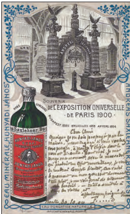
Hunyadi Keszervíz-reklám a Párizsi Világkiállításon (korabeli képeslap) 1900