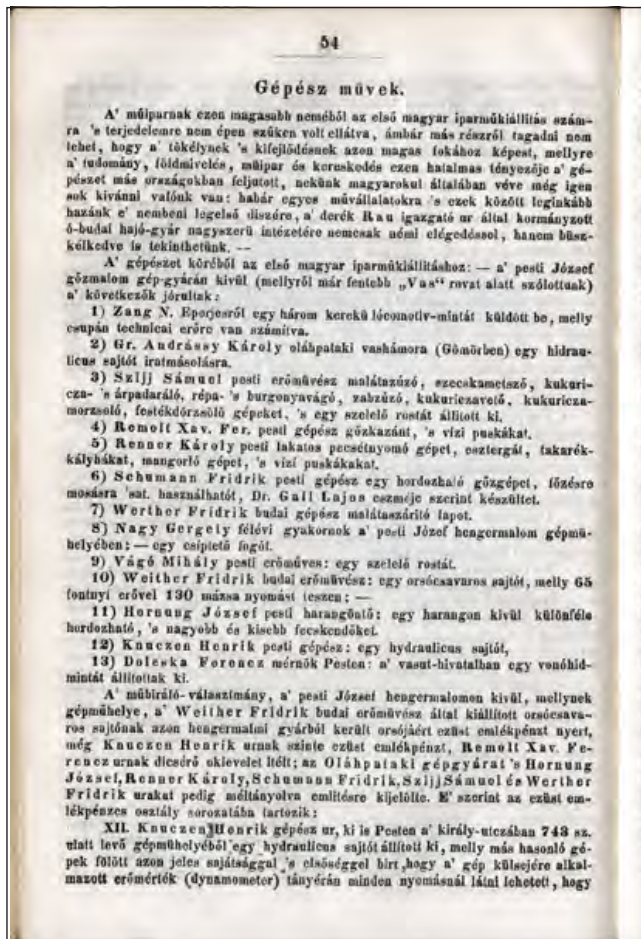
Részlet a Jelentésből