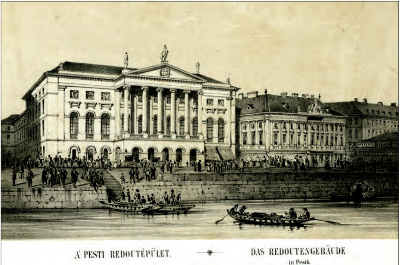
A PESTI REDOUTÉPÜLET.