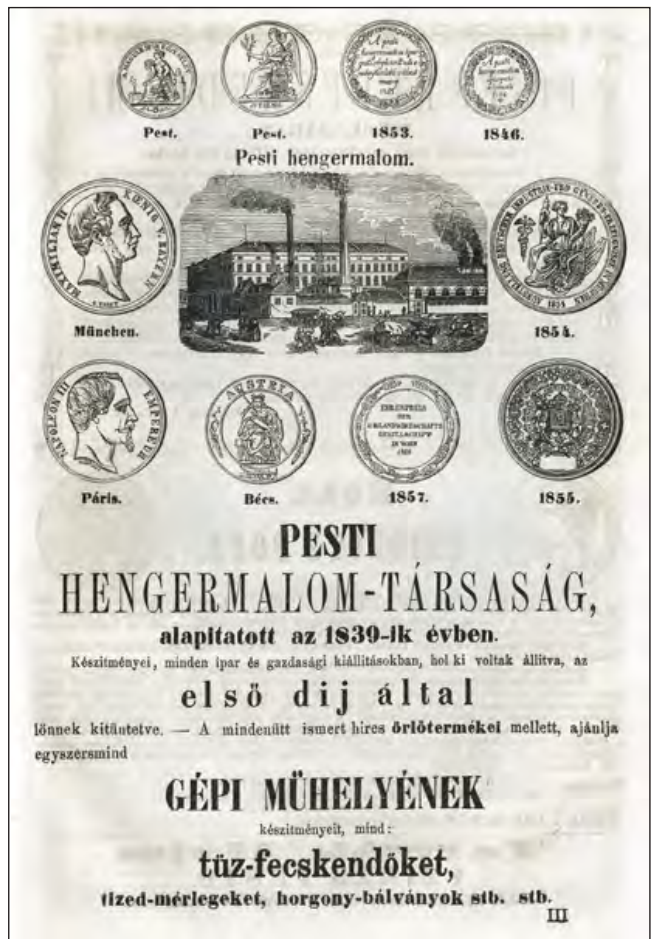
A Pesti Hengermalom gyár reklámlapja

tály is megtekinthesse). (...) Kik a kiállításba valamely iparművet beadtak, arról nyert nyugtatóványukat saját személyekre nézve mindenkor szabad belépti jegyül használhatják. A kiállított művek lajstroma a pénztárnál 10 pkr-on árultatik. Művek még mindig folyvást elfogadtatnak kiállításra, s az ezentől érkezendők lajstroma pótlólag szintűgy ki fog nyomtatni. A kiállítási irnokszobában aláírási ívek találhatók azok számára, kik az egyesület tagjaivá lenni kívánnának. Elnézést, uraim! s méltánylat a rövid idő melletti nehéz kezdetnek. Reméljük, ki ezen két körülményt tekintetbe veszi, örömmel látandja, s eléggülten hagyandja el az első magyar iparműkiállítást."