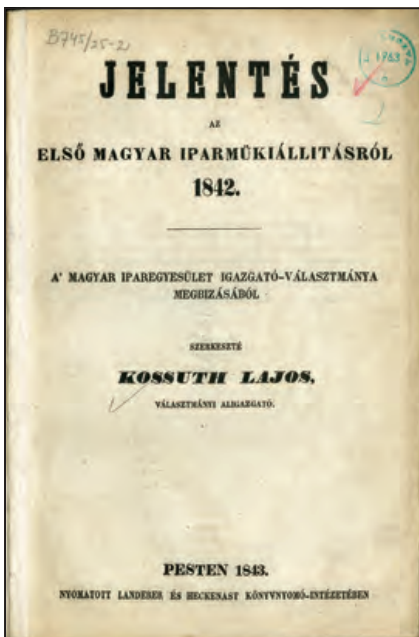
A Kossuth által írt Jelentés címlapja

nyitattik meg Pesten, a városi redout-épület melléktermeiben, s naponként reggel 9-1, ebéd után 3-6 óráig nyitva leend. Bemenet ára hétköznapokon 10 pkr, vasár- és ünnepnapokon 4 pkr. (miszerint a szegényebb osz-