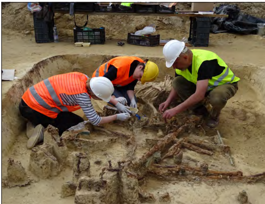
A kocsisír leleteinek kiemelése az Aquincumi Múzeum és a Magyar Nemzeti Múzeum restaurátorainak gondos munkájával

Véletleneknek, netán a beruházó jóindulatának köszönhető, hogy a sírt nem zárta szét egy munkagép, avagy törvényben biztosított, tudatos szakmai jelenlét és figyelem volt szükséges a lelet azonosításához és szakszerű feltáráshoz?