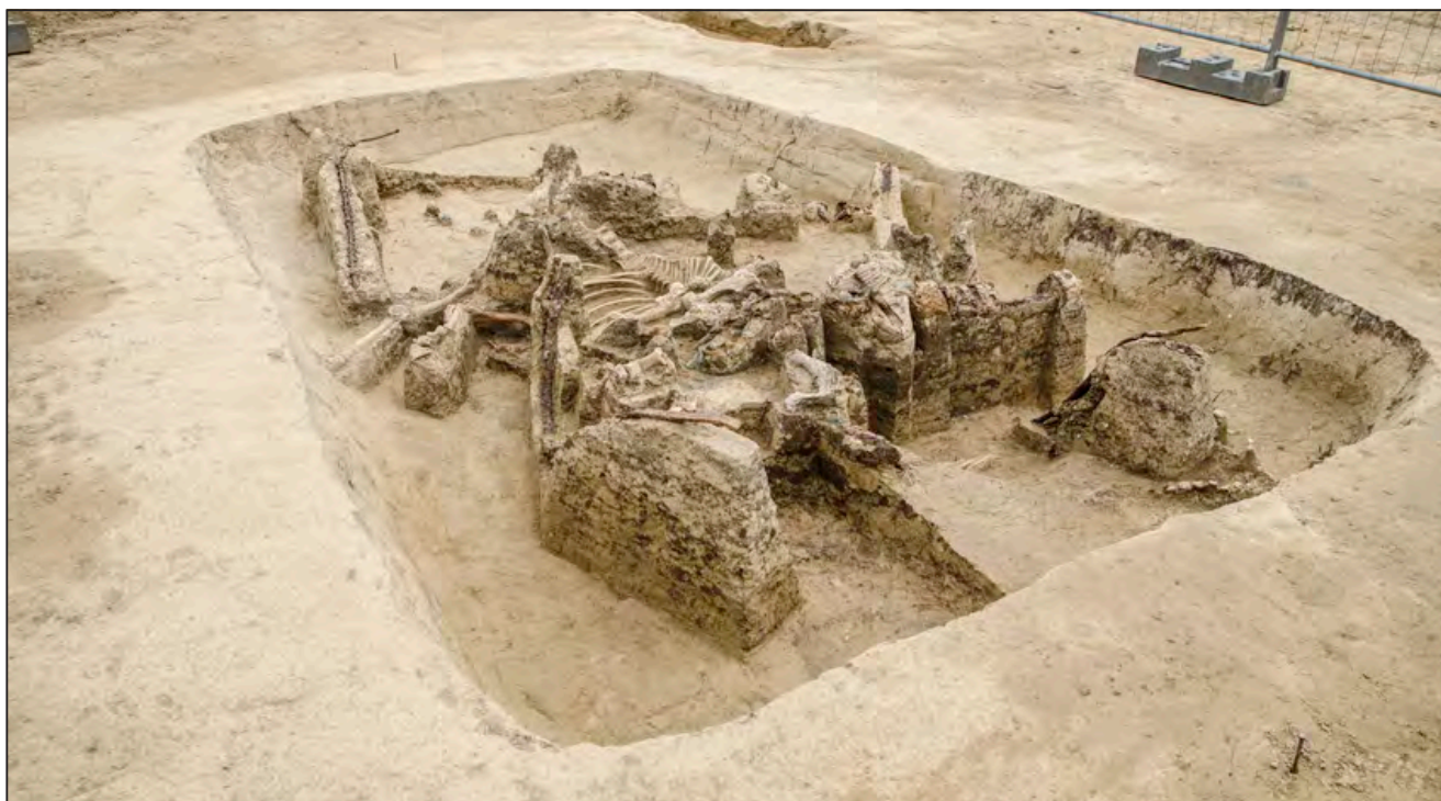
A kocsisír feltárt gödre, benne a római kori utazókocsi vasalkatrészeivel, bronzdíszítményeivel és a két leölt fogatos ló csontvázával