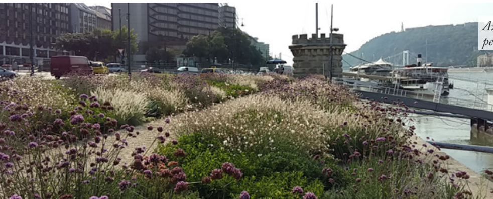
Az új trend jelei a Lánchíd pesti hídfőjénél