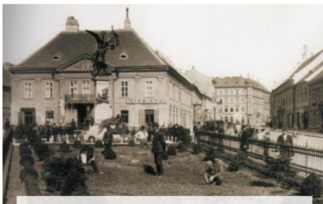
Dísz tér – tavaszi akció Budán az előző századfordulón

kek, amelyek maximálisan alkalmazkodnak egy-egy élőhelytípus-hoz (például a félárnyékhoz vagy a száraz, homokos talajhoz) és miután az adott területen teljes borítottságot érnek el, azt követően minimális gondozással és öntözéssel képesek színfoltjai lenni egy-egy parkrésztnek.