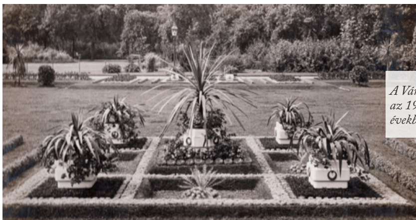
A Városligetben az 1910-es években

tenyészidejük miatt hosszú távon sokkal gazdaságosabb kiültethetők, városökológiai értelemben pedig sokkal hasznosabb növények tudnak lenni az egyényári díszeknél. Igaz viszont, hogy gondozásuk, telepítésük speciális szakértelemet kíván. Az utóbbi évek nagy vívmánya, hogy a FŐKERT egyes területeken