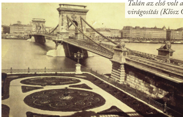
Talán az első volt a Clark Ádám téri virágosítás

Tekintettel arra, hogy a zöldfelületeknek ez az egyik legmunkaigényesebb, legnagyobb hozzáértést és fajtaismeretet követelő válfaja, a mai napig csak a legfontosabb városi zöldfelületeken jelenik meg, s a kerületek által fenntartott közterekben, közparkokban együttesen sincs annyi virágdísz, mint amit a főváros kertészeti vállalata, a 150 éves FŐKERT kezel. Számszerűsítve ez mintegy 12 ezer négyzetméternyi virágágyat jelent a város különböző pontjain, ahol közel kétszáz növényfajtaval dolgoznak a szakemberek. Ahhoz, hogy a kellő időben és a kellő mennyiségben „virágozzék száz virág”, olyan technológiai fegyver kell, amit a cég nem bíz beszerzésekre: kizárólag saját erőforrásból tudja a hatásos munkát üzembiztosan produkálni. A FŐKERT X. kerületi, Keresztúri úti növényházai jelentik régóta azt a masszív háttérbázist, ahol előállítják, és