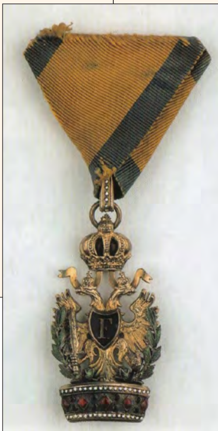
Vaskorona rendjének másolata (az eredeti elveszett)

Pest alaposan megváltozott, a félelem, a bizonytalanság lett úrrá. A tanulmányok folytatására csak a legbátrabbak jelentkeztek, a tanári kar egyelőre nem foglalkozott Korányi „szerepével”, mert egymással voltak elfoglalva. Balassa Jánost az Újépületben tartották fogva, a kiszabadításáért egy bizottság – amelyet Korányi vezetett – ment Prottmann rendőrfőnökhöz, talán ennek is köszönhető, hogy Balassát hamarosan szabadon engedték. Ekkor szövődött közöttük barátság: Balassa a még szigorló medikus Korányit tiszteletbeli segédjévé fogadta, és egy – haláláig őrzött – Lürer-féle sebészeti műszertárral ajándékozta