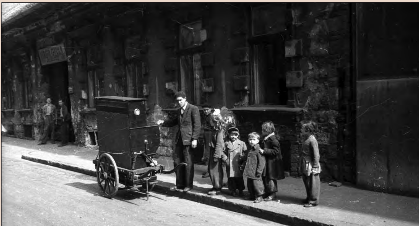
Verkli 1960-ban, ismeretlen helyszínén.