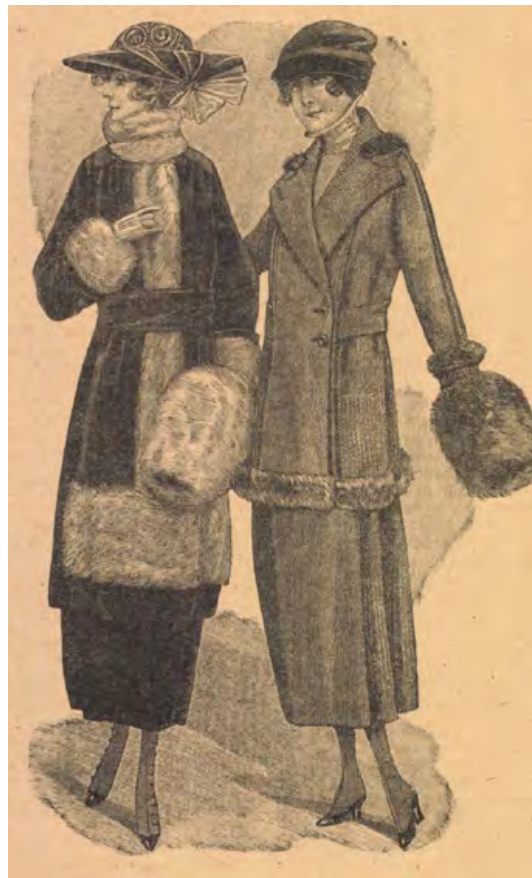
Az „elegáns téli öltözet szőrmedísszel” modellhez nem kevesebb, mint négy és háromnegyed méter 110 centiméter szélességű bársonyra, valamint 135 centiméter hosszú és 55 centi széles szőrmére volt szükség. (Tolnai Világlapja, 1918. november 16.)

Pénzért nem, csak hat régiért lehetett hozzájutni az „Elejétől végig halálra nevettek!”-ként ajánlott új 1918-as hanglemezhöz (Vasárnapi Ujság, 1918. november 3.)