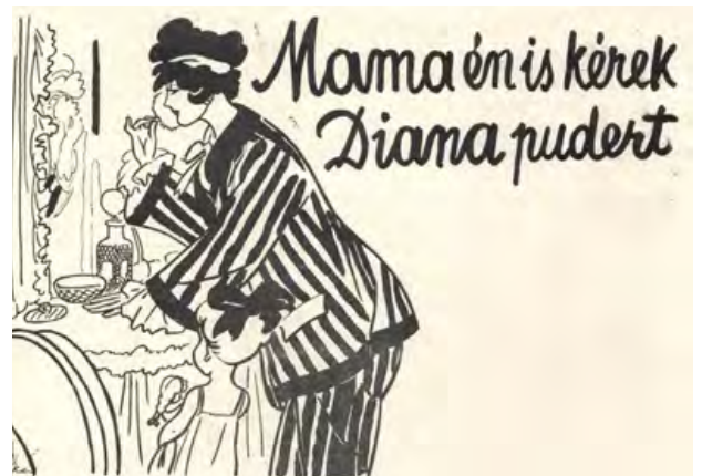
Az elsősorban sósorszeszeről híressé lett Diana Kereskedelmi Részvénytársaság az elsők között hirdette kozmetikai termékeit gyerekekkel (Vasárnapi Ujság, 1918. 43. sz.)

A színházaknál is nagyobb közönséget vonzottak az olcsóbb, szélesebb társadalmi rétegek számára is elérhető mozik. A főváros körülbelül