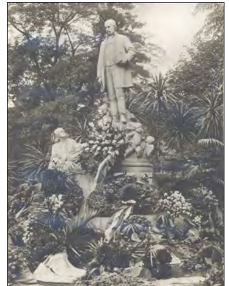
A megkoszorúzott Semmelweis-szobor születésének 100. évfordulóján. Erzsébet tér, 1918.

Semmelweis élete igazi „magyar sors”: életében mellőzik, elhallgatják, halála után viszont a mennybe emelik. Miután külföldön „felfedezik” Semmelweis nagyságát, honi befogadása is elkezdődik. Tetemét 1894-ben hazaszállítják a felszámolás alá kerülő bécsi temetőből, és a Kerepesi temetőben kap méltó sírhelyet. Társaság alakul emlékének ápolására, szoborpályázatot írnak ki. A millenniumi ünnepségekre készülő országnak szüksége van a „nagy emberekre”.