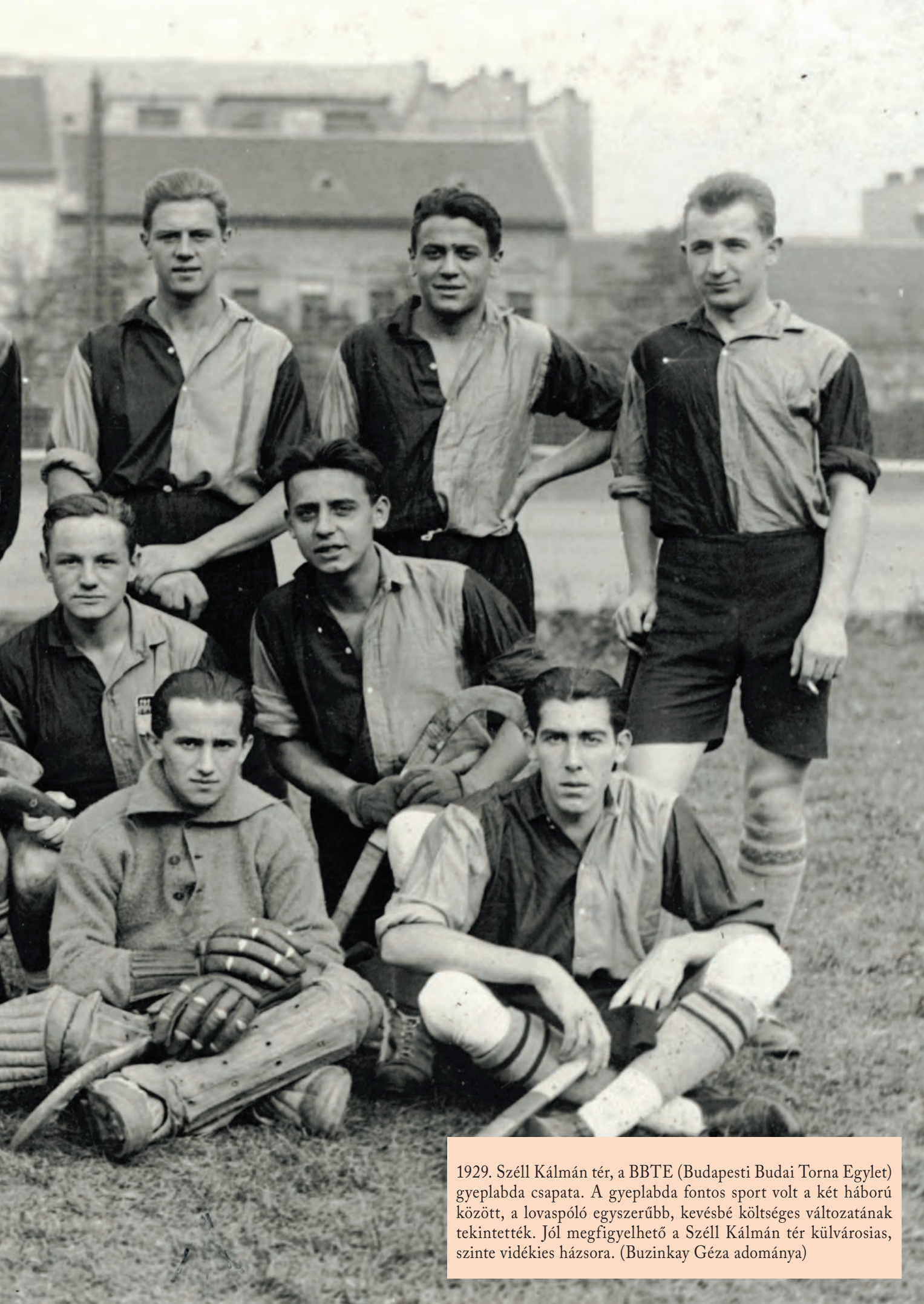
1929. Széll Kálmán tér, a BBTE (Budapesti Budai Torna Egylet) gyeplabda csapata. A gyeplabda fontos sport volt a két háború között, a lovaspóló egyszerűbb, kevésbé költséges változatának tekintették. Jól megfigyelhető a Széll Kálmán tér külvárosias, szinte vidékies házsora.