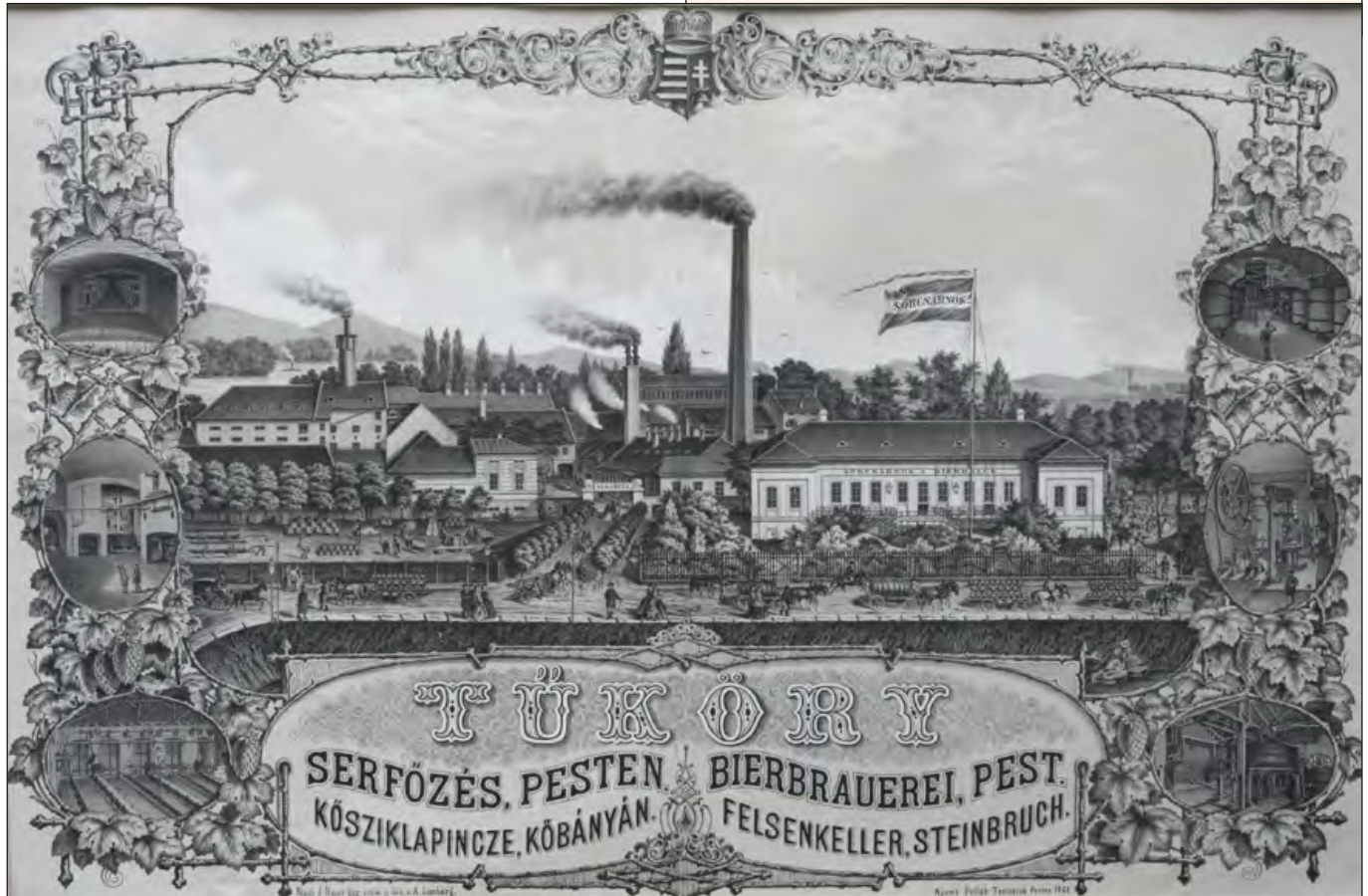
Tüköry sörözője és sörözősarnoka, 1860-as évek.

„débardeur” bálókra nem kellett, sőt nem is volt szabad hölgypartnert vinni. A mulató gondoskodott róla, hogy a mindössze cipőt, kesztyűt és álarcot viselő, hivatalból kedvesen készséges hölgyek mindenben megfeleljenek a férfiak igényeinek. Az Újvilágnak rövid idő alatt sikerült a tehetősebb urak köreiből odavonzania azt a közönséget, amely érdemesnek találta Bécs helyett inkább itthon elkölteni a pénzét, ezen a helyen, ami „...tánciskola, azaz bálterem, de olyan, a hová összesereglett Budapest minden kétes egzisztenciája, nő és férfi vegyesen. Ez volt az első nyilvános leánybörze Budapesten, a hol szemérmetlenül adtak, vettek.” Akár az ország távolabbi vidékeiről is érkezettek a vendégek, hiszen most már ott volt az igencsak gyors és kényelmes, áldásos vasút! Elvégre annyi üzleti és hivatali elintézendő szólította Pestre a nyugalmas, ám unalmas vidéki életbe belefáradt, költeni való pénzzel viszont bőven ellátott urakat! Az sem meglepő, hogy – amint az 100 évvel később is gyakran megesett – a vonzó hölgytársaságrt