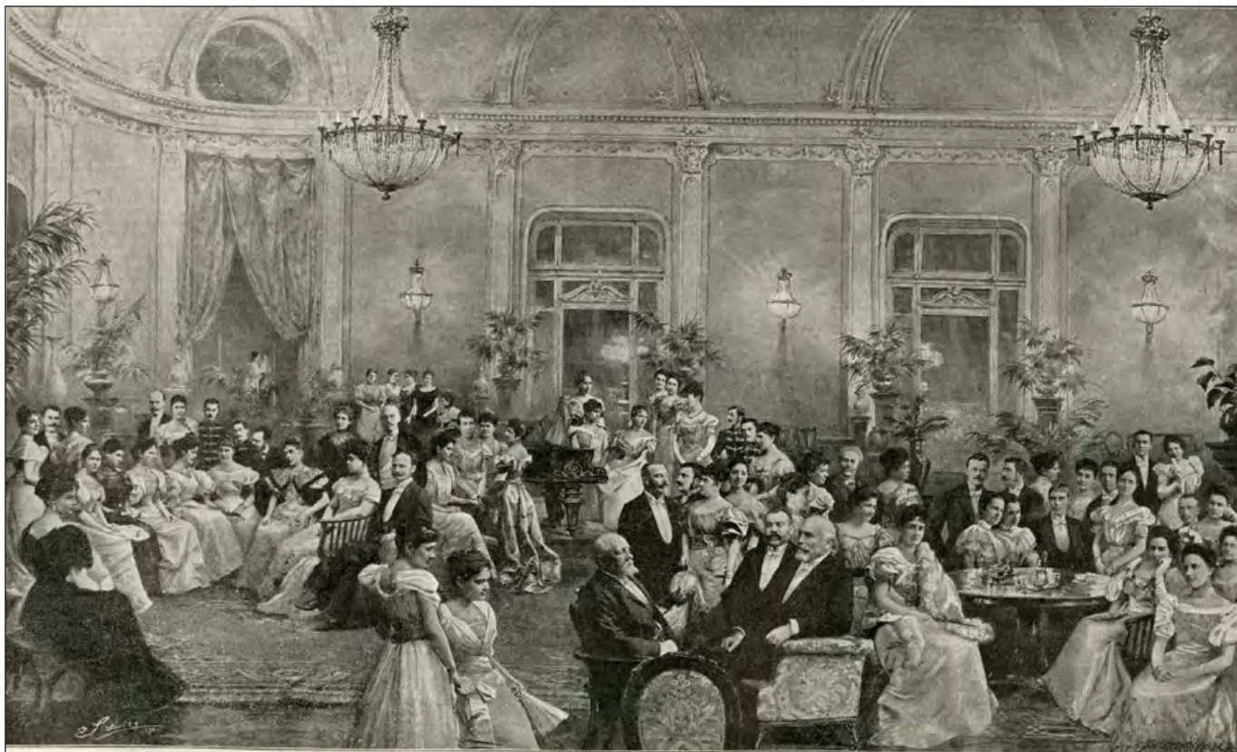
ESTÉLY A PARK-KLUBBAN. — CSOPORTKÉP STRELISKYTŐL.

Strelisky-műterem: Estély a Park Klubban, 1900. Montírozott csoportkép. Forrás: Vasárnapi Ujság